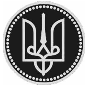
Княжий знак-тризуб великого князя Київського Володимира Святославича