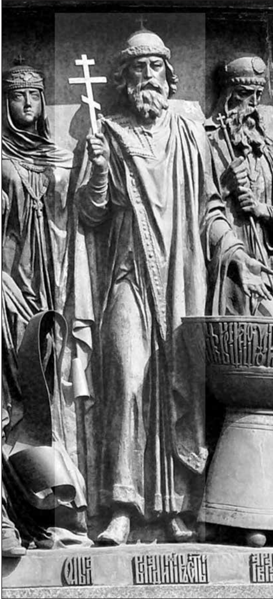
Володимир Святославич на пам'ятнику «Тисячоліття Росії» у Великому Новгороді

Володимир зробив спробу політичного освоєння теренів Східної Європи, пославши в її землі княжити своїх синів. Таким чином закладалися основи для патронімічної держави-федерації. Недаремно в період Середньовіччя й ранньомодерні часи східноєвропейські князі в своїх генеалогіях намагалися