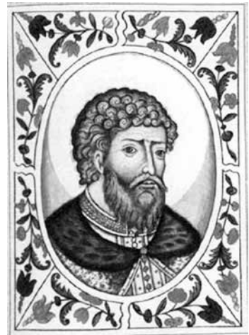
Ярослав Мудрий. Портрет із «Царського титулярника». XVII ст.

Що є причиною такої «затіненості»? За великим рахунком, у цьому був винен сам Ярослав Мудрий. У його особі маємо в дечому нетипового для Середньовіччя правителя. Він не відзначився військовими походами, не був щедрим, роздаючи гроші дружинникам — як це робили інші князі. Ярослав, говорячи сучасною термінологією, належав до державних менеджерів. Його діяльність, на перший погляд, не виглядала ефектно. Він піклувався про культуру, книжників, дбав про розвиток Церкви, розбудовував Київ та міста своєї держави. Така робота не особливо цінувалася сучасниками. Це ми спостерігаємо на прикладі «Повісті минулих літ», де загалом стримано описуються діяння цього князя. Проте з яким захопленням літописець пише про Ярославового брата-конкурента Мстислава, котрий передусім прославився своїми блискучими військовими походами. Ось як у цьому літописному