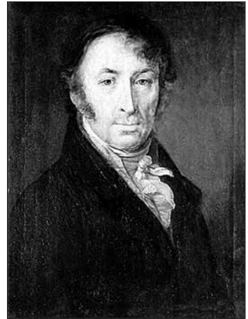
Микола Карамзін. Портрет кисті В. А. Тропініна (1818)

Не приділялася велика увага цьому князю і в російській імперській історіографії XIX ст. Відомий історик Микола Карамзін (1766—1826) коротко говорить про правління Ярослава Мудрого. Називає його «монархом всієї Росії», вказуючи, що той володарював «від берегів моря Больгійського до Азії, Угорщини й Дакії». Серед заслуг Ярослава Карамзін називає його перемогу над печенігами, у результаті