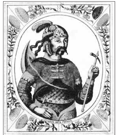
Рюрик. Мініатюра з «Царського титулярника». VII ст.

Безперечно, біля витоків Руської держави стояв батько Ярослава Мудрого — Володимир Святославич. За його часів Київ утверджується як столиця цього державного організму. Нагадаймо, що батько Володимира, Святослав, мав план перенести свій стольний град на Дунай. Говорив він матері Ользі й боярам своїм: «Не люблю мені є в Києві жити. Хочу жити я в Переяславці на Дунаї, бо то є середина землі моєї» 2 . Дунай же в ті далекі часи трактувався як слов'янська ріка. У «Повісті минулих літ» сказано, що «по довгих же часах сіли слов'яни по Дунаєві, де єсть нині Угорська земля і Болгарська. Од тих слов'ян розійшлися вони по Землі і прозвалися іменами своїми...» 3 .