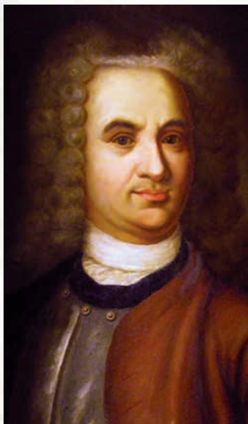
В. Татищев (1686—1750)

Ответ на этот вопрос давно и хорошо известен. Прадедом современной концепции истории Украины был известный каждому студенту-историку Василий Татищев.