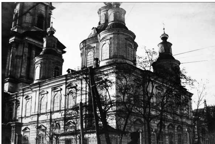
Успенский собор, фото С. Таранушенко, 1914 г.

В 1805 году по указу харьковского губернатора Ивана Ивановича Бахтина бывшие Полковницкая и Сотницкая улицы стали называться Университетской, ведь в быв-