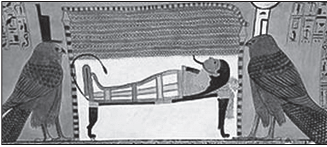
Ізіда і Непфтіс в образах шулік при мумії (XIII ст. до Р.Х.)

Якщо не чіплятися до лінгвістичних і орнітологічних деталей (зрештою, плутанина з шулікою і стерв'ятником є поширеним явищем у египтології як такій), образ птаха і його символічний зв'язок з матір'ю конкретно для Леонардо залишається чинним, тож немає підстав відкидати подальші міркування автора у цьому напрямі, включно з появою силуету «Geier» (стерв'ятника/шуліки) на картині «Святої Анни втрюх». У листі від 17 червня 1910 р. Юнг висловлює Фройді свій ентузіазм з приводу есе, і він перший знаходить на виставленій у Луврі картині обриси грифа, що «його дзьоб саме в паховій області». І аж 1913 р. пастор Пфістер, друг і учень Фройда, публікує статтю, що справила на експертне середовище сумнівне враження. Пфістер знаходить у композиції тієї таки картини іншого Geier (див. у тексті есе). Фройд підтверджує обґрунтованість відкриття у доповненні до видання 1919 р., але визнає, що «не кожен почуватиметься готовим визнати його переконливим».