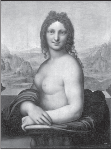
Салаї. Монна Ванна