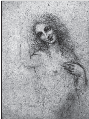
Леонардо да Вінчі. Так званий «Втілений янгол»

Знавець мистецтва З. Фройд міг, однак, помилятися щодо мотивів написання «Святої Анни втрюх». Зазначаючи, що Леонардо обрав сюжет, який «нечасто зустрічаємо в італійському живописі», автор не враховує, що саме на той час,