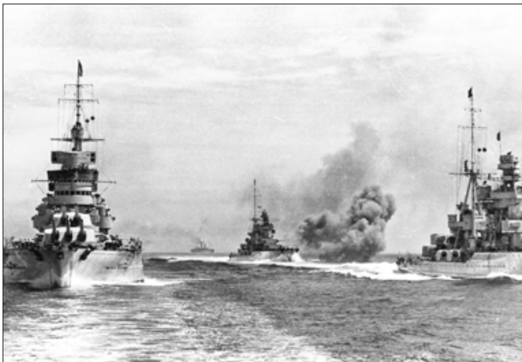
Італійські крейсери під час огляду флоту

Легких крейсерів італійський флот мав 14. Два з них — це колишні німецькі кораблі, отримані після Першої світової війни. У 1930-х роках вони вже були безнадійно застарілими. Інші 12 кораблів належали до типу «Кондотьєрі». Усі вони вступили до складу флоту упродовж 1931—1937 рр. Тип «Кондотьєрі» поділяється на п'ять груп. До першої належали «Альберіко да Барбіано», «Альберто ді Джуссано», «Бартоломео Коллеоні» і «Джованні делле Банде Нере», до другої — «Луїджі Кадорна» й «Армандо Діаз», третьої — «Раймондо Монтекукколі» і «Муціо Аттендоло Сфорца», четвертої — «Еммануеле Філіберто Дука д'Аоста» й «Еугеніо ді Савойя», п'ятої — «Луїджі ді Савойя Дука дель Абрुцці»