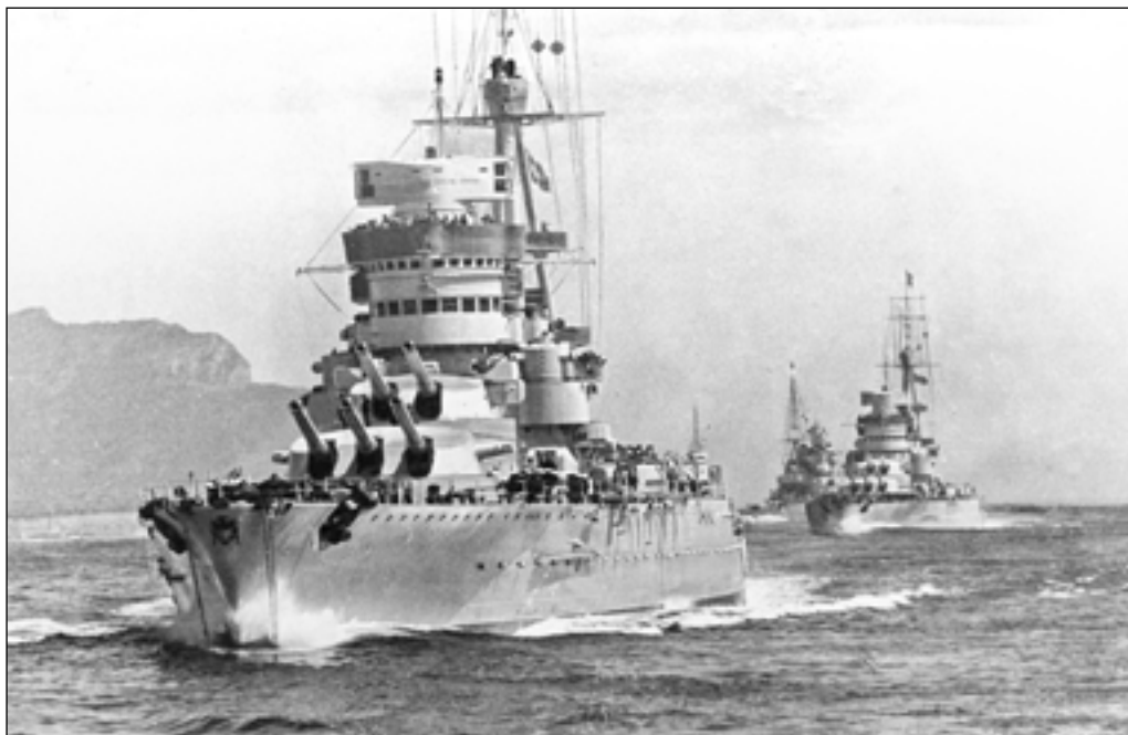
Лінкор «Конте ді Кавур», а за ним «Джуліо Чезаре» і «Кайо Дуїліо». 1940 р.

вогнем, посилене бронювання. У 1937—1940 рр. схожу за обсягом модернізацію пройшли лінкори «Андреа Доріа» та «Кайо Дуїліо». До бойового складу флоту вони повернулись невдовзі після вступу Італії у війну.