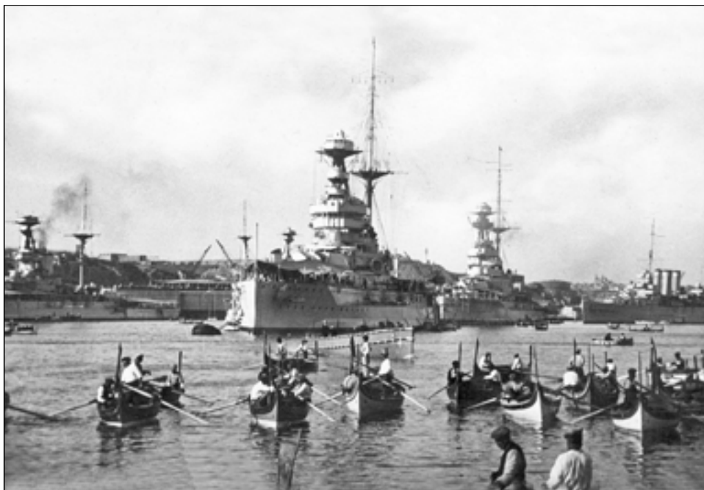
Британські військові кораблі на Мальті. Цей острів був ключовою базою британського Королівського флоту на Середземному морі

їні пробританські й антиіталійські настрої були ще сильнішими, ніж у Югославії. Італійська окупація Албанії навесні 1939 р. призвела до загострення ситуації в регіоні й погіршення геополітичного становища Греції.