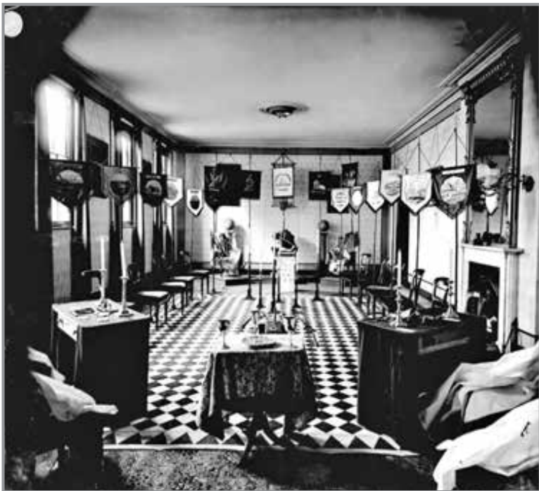
Масонська ложа (обряд Королівська Арка). Поч. XX ст. Графство Саффолк, Велика Британія. Суспільне надбання

універсалізм. Масонство допомагає пройти шлях, але не претендує на обов'язковість. Для масона, — вважає В. Кустов, — удосконалення рівнозначне самобудівництву, він покликаний вічно будувати, просувати справу зростання, пізнання — таким є його призначення. Цю велику справу він повинен потім передати світу. «Храм» є не тільки відображення світу, але і відтво-