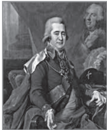
І. Безбородько. Худ. Д. Левицький. Суспільне надбання

Саме він 1820 р. заснував в м. Ніжин перший світський університет на території сучас-