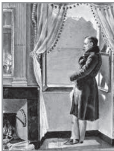
В. Жуковський біля вікна. Суспільне надбання

І далі супроводжували національного генія та пророка неіснуючої на той час нації впродовж усього його життя. Це і «луфтон» (тобто син масона), один із основоположників сучасної російської мови та літератури, випускник безбородьківського ліцею Нестор Кукольник, і «луфтон», полтавчанин, вихідець з козацької родини Петро Мартос, «луфтон», видатний російський композитор Михайло Глінка, і масони — уродженець українського Пирятина, видатний мистецтвознавець Василь Григорович, і нащадок чернігівських Рюриковичів, малоросійський гене-