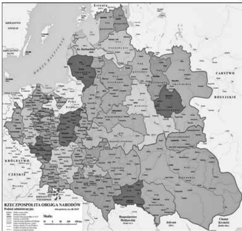
Адміністративний поділ РП. 1615 р.

на справа». «Спільна справа» трьох народів — польського, руського (тепер ми називаємо себе «українцями») та литовського. Усі вони, а також представники інших автохтонних національних груп числом кілька десятків, згідно з діючими тоді законами, були поділені на 5 соціальних верств: