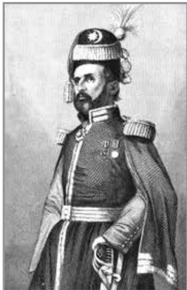
М. Чайковський/ Мехмед Садик-Паша (1804—1886 рр.). Худ. А. Олесницький. Суспільне надбання