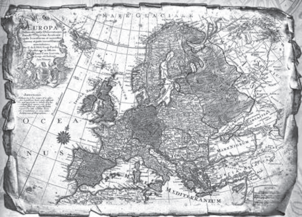
Політична мапа Європи. Поч. XVIII ст.