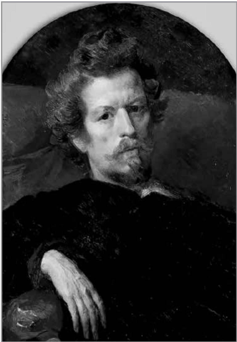
К. Брюллов (1799—1852 гг.). Автопортрет. Суспільне надбання