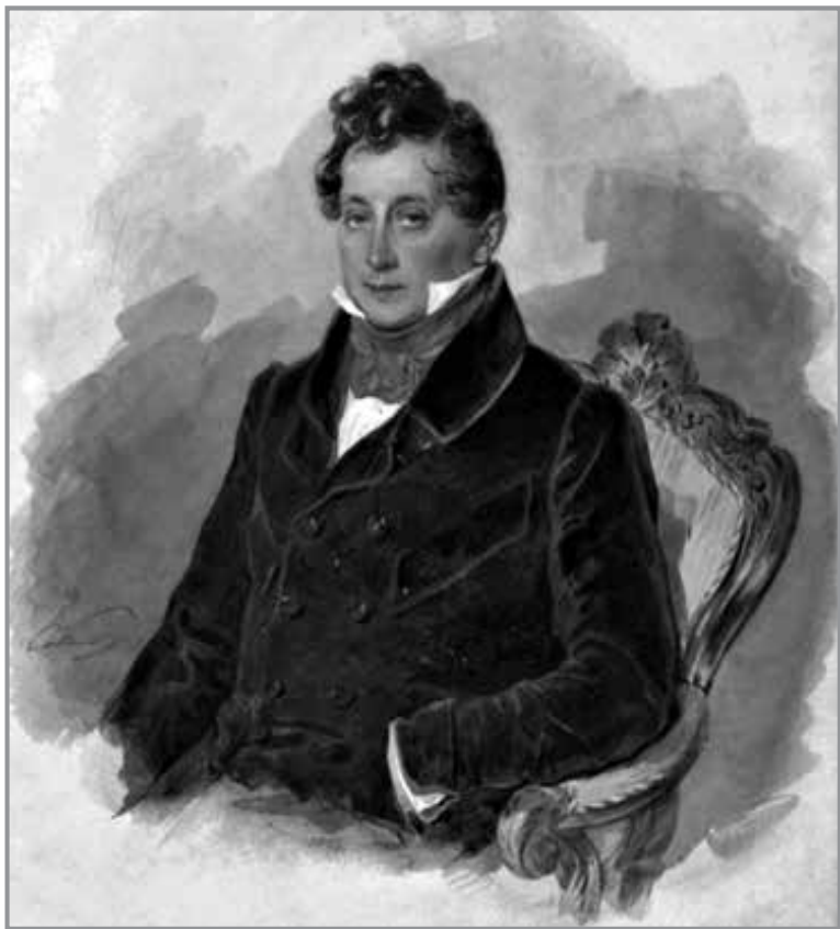
М. Віельгорський (1788—1856 рр.). Худ. П. Соколов. Суспільне надбання

тора Александра II (до слова, також вільного муляра) Василь Жуковський, відомий музикант, польський шляхтич за походженням, граф Міхал Віельгорський та інші ініціювали та організували 1838 р. викуп з рабства Тараса Шевченка.