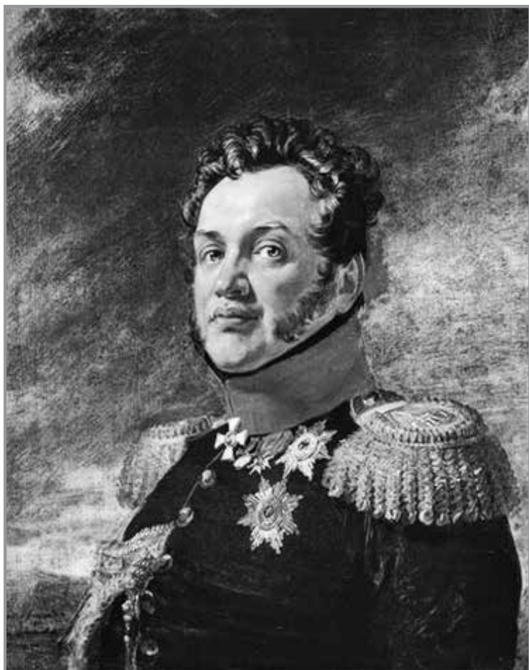
М. Рєпнїн-Волконський (1778—1845 рр.). Худ. Д. Доу. Суспільне надбання

спроєктоване ними місто біля Савченка, стати домом «для всіх народів та релігій», сакральним і духовним центром на південно-сході Європи, форпостом,