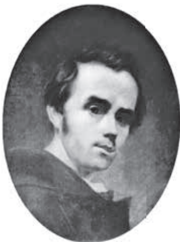
Т. Шевченко. Автопортрет. 1840—1841 рр. Суспільне надбання