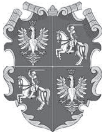
Герб Речі Посполитої

Ця книга про людей, імена яких більшості з вас добре знайомі зі шкільних років.