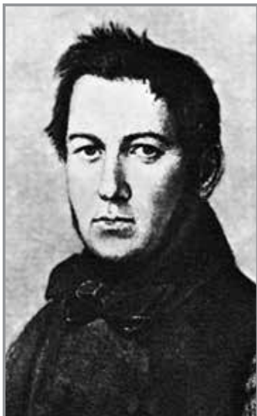
М. Глінка (1804—1857 рр.). Худ. Я. Яненко. Суспільне надбання