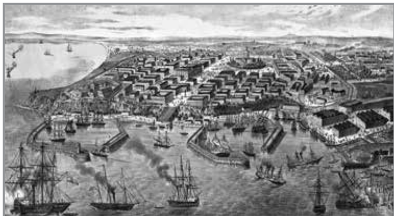
План м. Одеси. 1850 р.