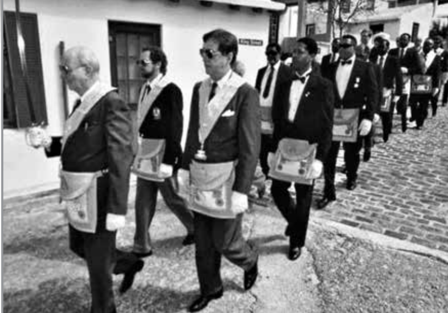
Масонський парад, Бермуди. Сер. 80-х рр. XX ст.