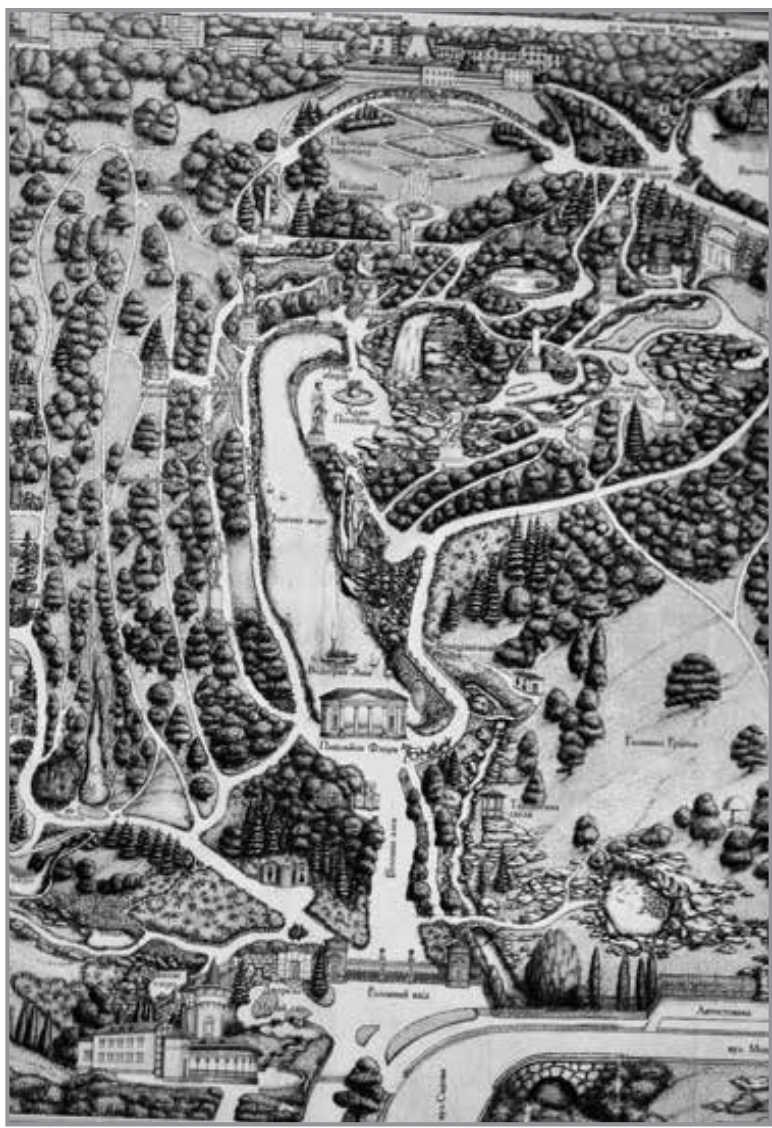
План парку Софіївка.