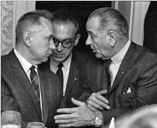
О. Косигін.