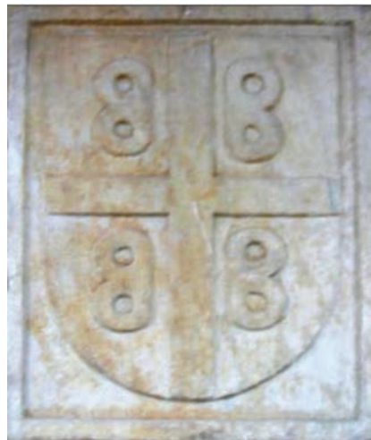
Іл. 6: Візантійський герб на Галатських воротах у Константинополі XIV ст.

На печатці 1391 р. Феодора I Палеолога деспота Мореї (1383—1407), сина імператора Йоана V Палеолога, було зображено повний герб, що складався зі щита, шолома й нашоломника з двоголовим орлом 33 .