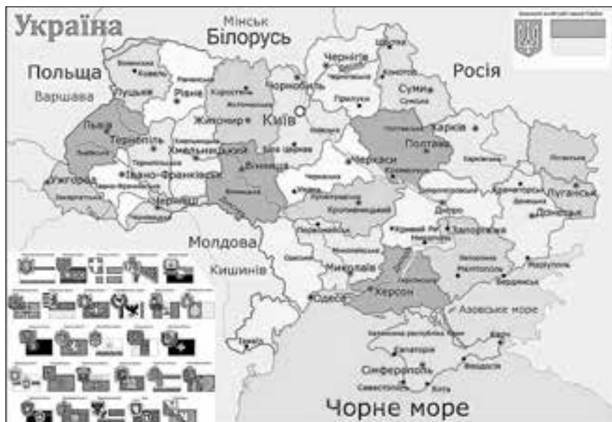
Україна. Адміністративна карта.