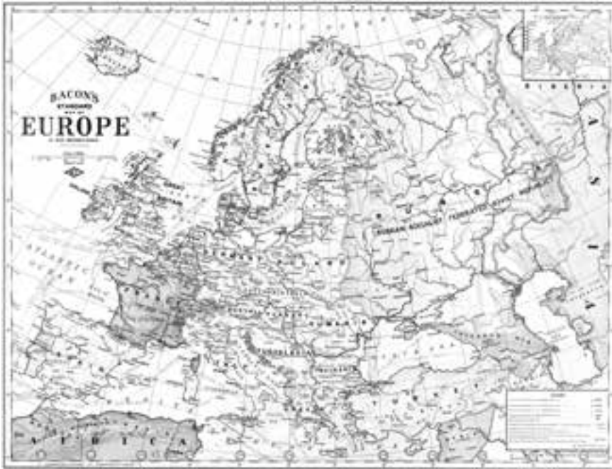
Європа. 1923 р. Суспільне надбання

Насамкінець вважаю необхідним наголосити окремо на обставинах, які вперто, послідовно, принципово ігнорували та ігнорують покоління українських і не тільки дослідників поза країнами їх проживання.