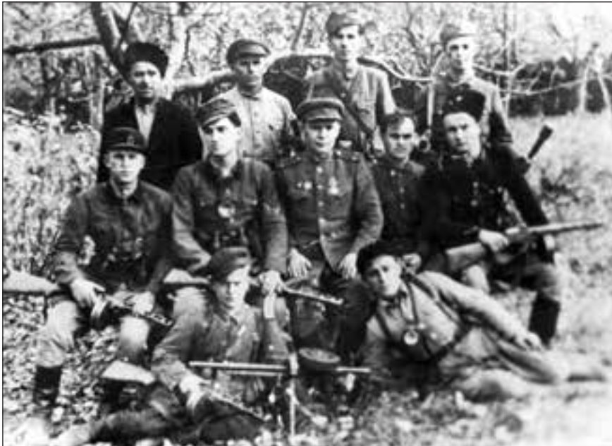
«Легендована» спецгрупа МГБ.

Четверте: ані сучасна держава Україна, ані її громадяни не несуть відповідальності за дії, вчинки та злочини, які, можливо, вчиняли, вчиняють і будуть вчиняти етнічні українці, громадяни американських та європейських держав.