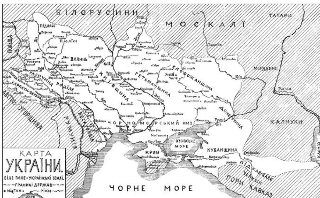
Українські етнічні землі за Михайлом Грушевським