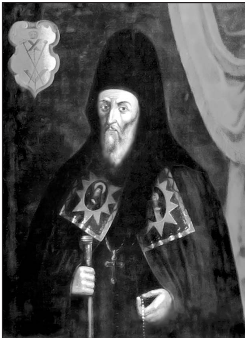
Інокентій Гізель. Копія з портрета XVII ст.