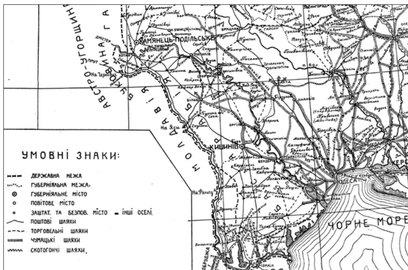
Чумацькі шляхи. Фрагмент мапи торговельних шляхів України першої половини XIX ст. географа та історика Ф. Петруня

бездоріжжя, від 500 до 3000 возів, завантажених хлібом. Це були „чумацькі валки” — обози, запряжені круторогими сірими волами — „верблюдами українських степів”. Щорічно число возів, що прибували до міста, доходило до 200 тисяч». [38, с. 72–73]