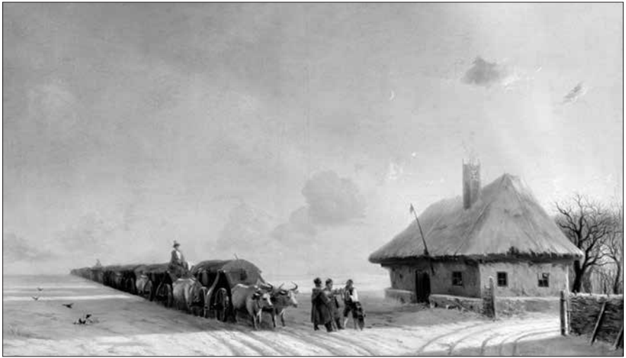
Чумаки. Картина І. Айвазовського. 1870-ті рр.

колишній Херсонській губернії, а далі переходила в сусідні губернії: Подільську, Київську, Полтавську, Катеринославську і Таврію». [12, с. 70–71] Детальніше характеризуючи головні шляхи одеського чумацького «віяла», Н. Букатевиц, зокрема, писав: «Шлях, що йшов від Одеси через Северинівку, на Ананьїв, Балту теж зв'язував Одесу з Поділлям і Волинню. Цим шляхом з Одеси везли бакалію і вина, а до Одеси приставляли великі транспорти з хлібом. З Поділлям та Київщиною Одеса зв'язувалася шляхом, що проходив через Березівку на Мостове, Щасливе в Богопіль, Ольвіопіль, Ревуцьке, Торговицю. Тут проходили найбільші транспорти з хлібом. Шлях меншого значення йшов на Одесу через Новомиргород, Новоукраїнське, Жукове і Вознесенське. Полтавщина зв'язувалася з Одесою через Кременчук, Олександрію, Єлисаветград, Рівне, Вознесенське. Цим напрямком до Одеси йшло збіжжя, сало, шерсть, горілка, а з Одеси, як і іншими шляхами, бакалія і вино. У Єлисаветграді до цього шляху приєднувався той, [що] йшов з Черкас — Чигирина. Через Шестерню, Березнеговате, Засілля, Миколаїв, Попівку проходив шлях з Катеринославщини, яким поставляли до Одеси вовну іспанських овець, сало, масло, ллянаєнасіння, а також збіжжя, особливо пшеницю арнаутку.