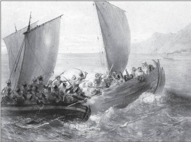
Григорій Гагарін. Азовські козаки беруть на абордаж турецький корсар

Написання «козак» українською або «казак» у російській історіографії не суперечать одне одному. Інша річ в інтерпретації людей цієї спільноти, коли в Росії заведено називати їх «росіянами», хоча перша згадка «козаків» сягає XIV століття та згадується в значенні «вартового» в писемній пам'ятці — багатомовному перекладацькому словнику куманської (старокипчацької) мови 1303 року, коли самої Росії як держави ще й близько не було, але вже формувалося