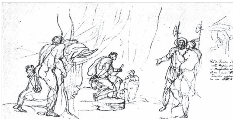
Христофоро де Кастеллі. Нариси із Самегрело, 1640-ті рр.

Так чи інакше, Василь потрапив до Грузії хоч і не добровільно, але посів гідне місце й, судячи із записів послів, навіть був радником Левана II Дадіані щодо геополітичних питань, пояснюючи князю відмінність церков Московії та Литви, з якою Дадіані хотів встановити відносини. Він був одним із тих, хто й раніше плавав на торгових човнах до