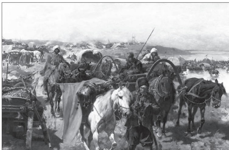
Юзеф Брандт. Обоз запорожців. 1880 р.

ко. Майже всі «корінні» українці, чіїх предків переселили до Грузії в середині XIX століття, розмовляють грузинською, вважаючи її рідною. Лише з прізвиськом Мартиненко нині в Грузії мешкає близько трьох тисяч людей.