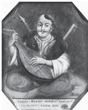
Автор невідомий. Козак Мамай. XVIII ст.

султанські галери (військові кораблі) виявили дванадцять козацьких човнів «в гирлі однієї річки в країні Мегрелії за Трапезундом» і триста козаків, які там «оселилися й закріпилися».