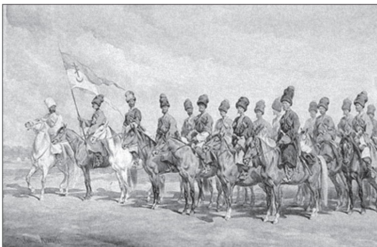
Юліуш Коссак. Донські козаки. 1877 р.

об'єднання людей, які два століття потому називали себе «запорізькими козаками».