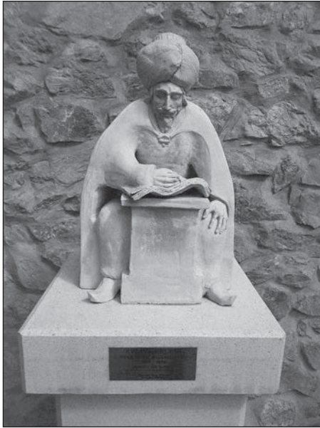
Пірос Ростас Беа. Пам'ятник Евлію Челебі

Італійські місіонери Джовані Куліано і Патрі Лука дали опис однієї грузинської церкви на узбережжі, де «на трапезі стояла одна тарілка з грішми золота і срібла, спитав священника — хто пожертвував ці кошти, той відповів — козаки, вони з річок Дону та Дніпра човнами заходять у Чорне море на грабіжницькі рейди проти османів і татар, і коли повертаються зі здобиччю, тут, у церкві, моляться і залишають кавказцям гроші».