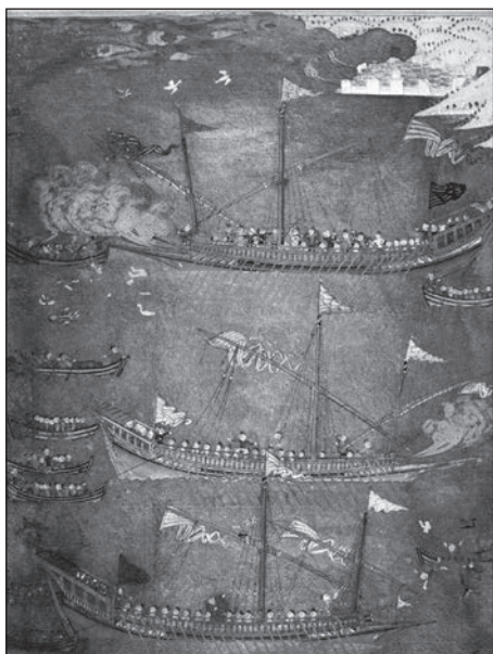
Невідомий турецький автор. Зіткнення української чайки з турецькими галерами, 1636 р.

ли справжню морську війну, стверджував історик козацтва Володимир Корольов. Постійні нальоти на османські укріплені фортеці й військово-морські бази, порти й торговельно-ремісничі центри, напади на сам Стамбул, призвели до того, що за однієї згадки про появу на обрії козачого струга або чайки купецькі судна припиняли виходити в море, команди кидали їх напризволяще, населення приморських селищ, залишаючи майно, рятувалося в містах або навколишніх горах, а солдатів доводилося палицями заганяти на кораблі, що їх надсилали проти козацьких флотилій.