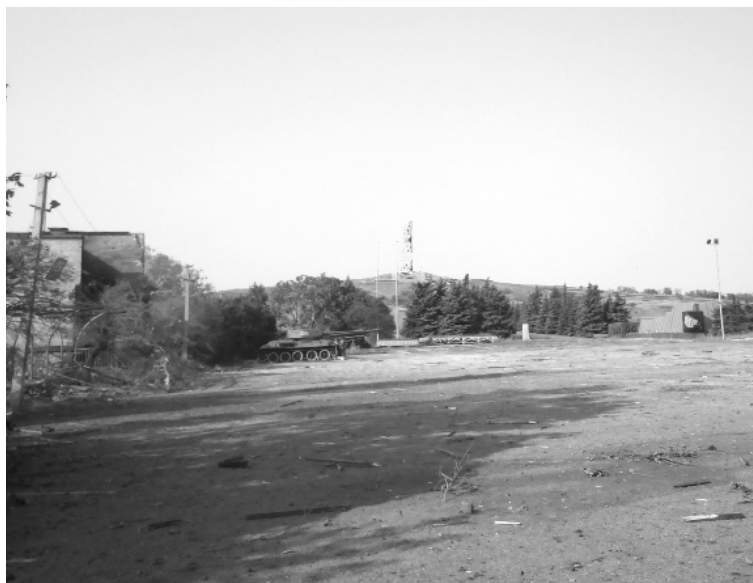
Вид на Саур-Могилу с нижней площадки

Череда лиц. Родных и малознакомых. Некоторые не вернулись с той Шайтан-Горы. Другие нашли свою смерть в иных квадратах под другими координатами. О судьбе остальных можно лишь догадываться, надеяться что всё у них сложилось хорошо. Номера поменялись, телефоны сторели, люди канули в реку войны. Вынырнут ли они однажды из неё — никто не знает. Берегов пока не видно.