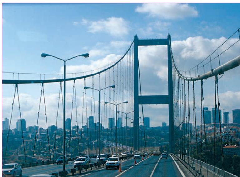
Мост через Босфор

Крайняя северная точка Турции — мыс Инджебурун — расположена на побережье Черного моря, рядом с городом Синоп. Крайняя южная — мыс Анамур, который находится на берегу Средиземного моря, недалеко от одноименного города; крайняя западная — мыс Баба — также является и самой западной точкой Азии; крайняя точка на востоке страны расположена на границе провинции Ыгдыр.