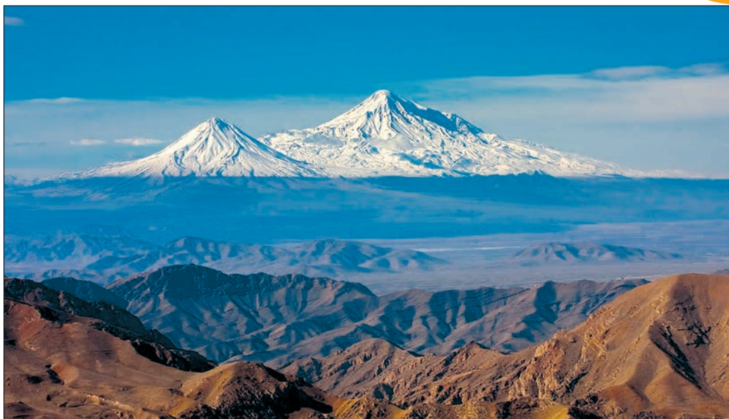
Белоснежные вершины горы Арарат

встречаются минеральные натечные образования гребенчатой и бахромчатой формы. Эти белые сталактиты, образовавшиеся в результате медленного просачивания воды в горные породы, представляют уникальную картину, в частности в ущелье Чукурсу, и получили название Памуккале («Хлопковая крепость»).