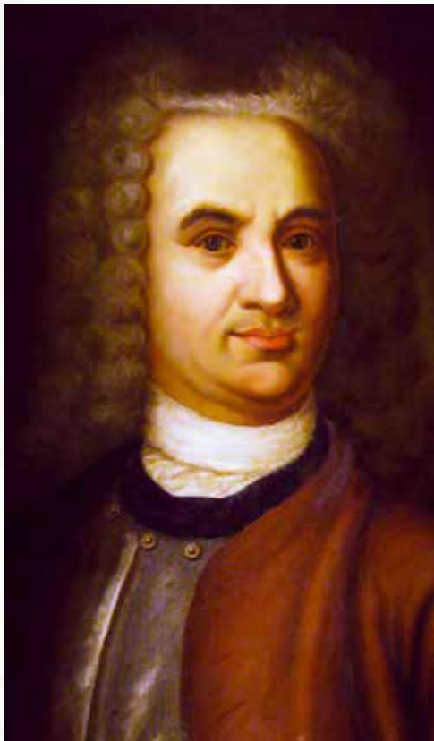
В. Татищев (1686—1750)

Відповідь на це запитання давно і добре відома. Прадідом сучасної концепції історії України був відомий кожному студентові-історикові Василь Татищев.