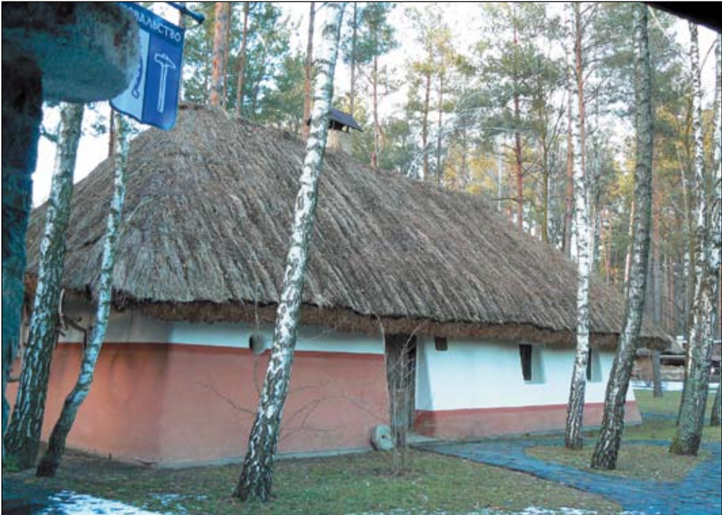
Хата с наклоненными стенами. Именно она изображена на логотипе комплекса

Этнический ресторан и гостиничные домики — это лишь часть большого этнографического комплекса «Украинское село», который появился тут около 10 лет назад.