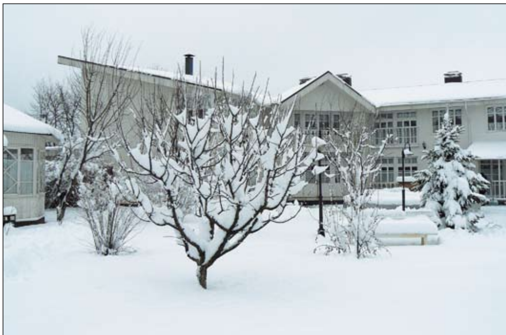
Ресторан «Бабушкин сад»

дни тут бывают пробки на выезде из города. Из Бузовой в Ясногородку есть прямая дорога по проселкам, но зимой лучше сделать небольшой крюк через Мрию и Лычанку.