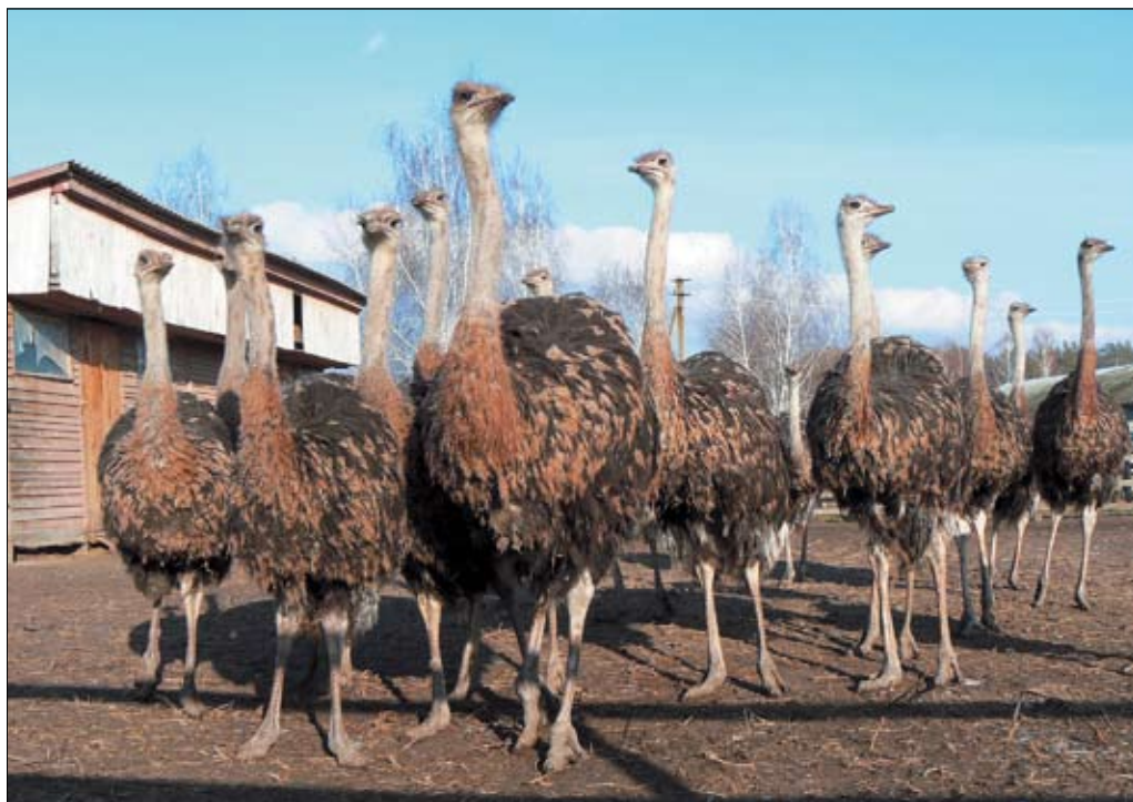
Ферма «Долина страусов»

Восемь лет назад новые хозяева обычной птицефермы решили превратить ее в