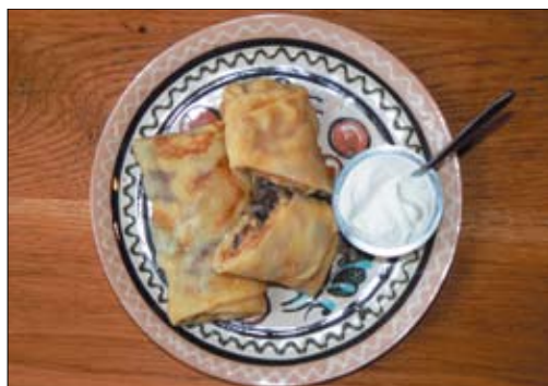
Блины с курицей

Народный ансамбль с песнями и плясками, а также специальное блинное меню из семи позиций — традиционная масленичная программа загородного ресторана «Бабушкин сад». Заведение в яблонево-