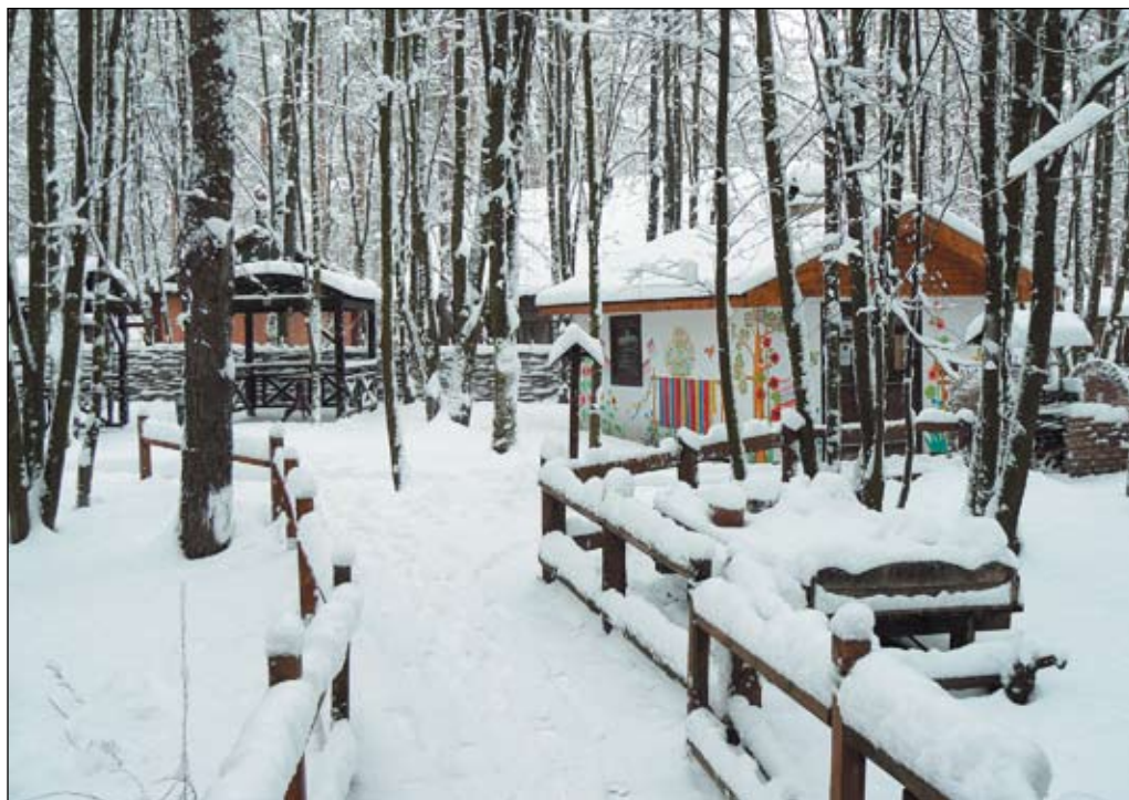
Этнографический комплекс «Украинское село»

Кстати, в «Украинском селе» считают, что Масленица — это русская традиция: блины, тройка, балалайка. А у нас это праздник Колодия, завершающий зимний цикл. Колодка — символ зимнего холода, скуки, застоя и нерешительности. Ее привязывают веревкой к неженатым парням и незамужним девчатам, чтобы требовать с них выкуп