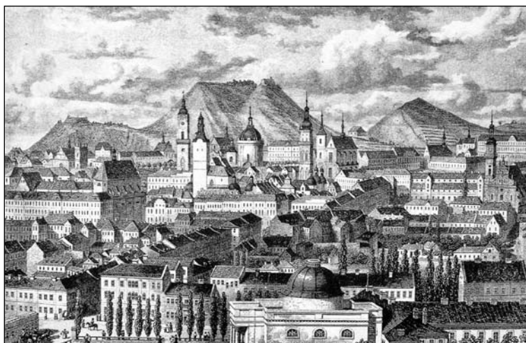
Вигляд Львова з гори Вроновських у 1840 році. Рис. Теофіла Чишковського

Ставилися питання щодо впровадження мови корінного населення у міський простір. Ще на засіданні Головної Руської Ради 8 вересня 1848 р. парох с. Рудно о. Трещаковський запропонував внести до магістрату прохання, щоб назви вулиць у Львові писали теж руською мовою. Подібну вимогу висунув на засіданні Ради 17 листопада 1848 р. професор академічної гімназії, парох церкви Св. Петра і Павла о. Іван Жуківський — щоб «магістрат Львівський свої повідомлення оголошував руською мовою, і щоби по руськи були написи вулиць і площ львівських» (Головна Руська Рада (1848—