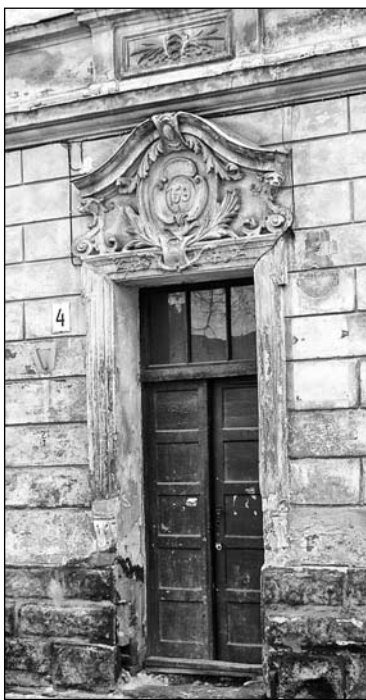
Конскрипційний № 159 \frac{3}{4} над брамою кам'яниці на вул. Ткацькій, 4

Середмістя поступово звільнялося від кільця фортифікацій й відкривалося для світу та передмість. Розпочали ці роботи із західного боку, де через Полтву збудували три кам'яні містки. До 1790 р. були ліквідовані фортифікаційні укріплення з південної і північної сторін, а в 1802 р. розібрано споруди Низького замку та костелу Св. Духа. Цеглу та камінь з розібраних споруд продавали міщанам для будівництва. Землею з валів засипали рови. Укріплення зі східного боку почали розбирати на початку XIX ст., однак залишили тут Порохову вежу та обидва арсенали. На місці розібраних фортифіка-