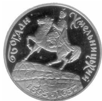
Пам'ятна монета 200 тисяч карбованців, 1995 р.