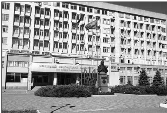
Черкаський національний університет імені Богдана Хмельницького

Указом Президії Верховної Ради СРСР від 10 жовтня 1943 р. був встановлений орден Богдана Хмельницького, призначений для нагородження командирів та бійців Червоної армії і Військово-Морського флоту, керівників партизанських загонів і партизан, які особливо відзначилися під час звільнення радянської землі від німецьких загарбників 7 . Як бачимо, з'явилася ця нагорода у часи т. зв. «Великої Вітчизняної війни», коли існувала потреба мобілізувати українців для захисту «соціалістичної вітчизни». У 1995 р. у незалежній Україні орден Богдана Хмельницького був встановлений на відзнаку видатних заслуг громадян України, а також іноземних громадян та осіб без громадянства перед Українською державою 8 .