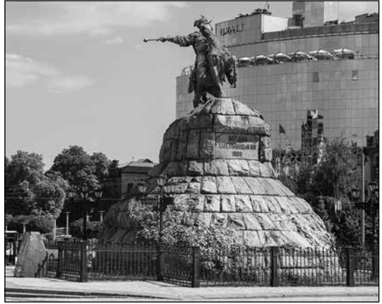
Пам'ятник Гетьману України Богданові-Зиновію Михайловичу Хмельницькому в Києві

Вулиці Богдана Хмельницького є в багатьох українських містах, навіть у селах. Є такі вулиці й у містах Росії, Білорусі й Казахстану. Зокрема, в цих державах вулиці Хмельницького знаходяться в столичних містах. У Москві вулиця Богдана Хмельницького — це колишня Маросейка (саме на ній після Переяславської ради селилися вихідці з Малоросії, тобто України). У Казахстані вулиці Хмельницького є в колишній столиці Алмати й нинішній Астані 2 . Існує чотири проспекти Богдана Хмельницького — у Дніпрі, Мелітополі і... нині захопленому проросійськими сепаратистами Донецьку. А ще є такий проспект у місті Біл-