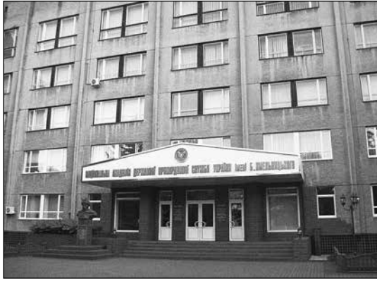
Національна академія Державної прикордонної служби України імені Богдана Хмельницького в місті Хмельницькому

Іменем Хмельницького названі й міста. У 1943 р. Переяслав було перейменовано на Переяслав-Хмельницький 2 . А в 1954 р., у рік 300-літнього ювілею Переяславської ради, Проскурів перейменували на Хмельницький 3 . Відповідно, область, центром якої стало це місто, почала називатися Хмельницькою.