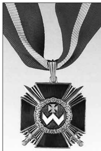
Орден Богдана Хмельницького

Автор пропонованої роботи спочатку спробує розібратися з тим, як творилися образи Хмельницького, різні міфи про нього. Далі подаватимуться реальні факти, що стосуються діянь Хмельницького, а також той контекст, у якому вони відбувалися. На завершення подане осмислення діяльності Хмельницького в історичному процесі.