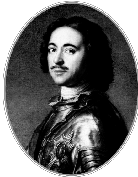
Российский император Петр I. Худ. Ж.-М. Натье