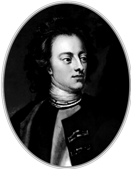
Король Швеции Карл XII. Худ. М. Дахл