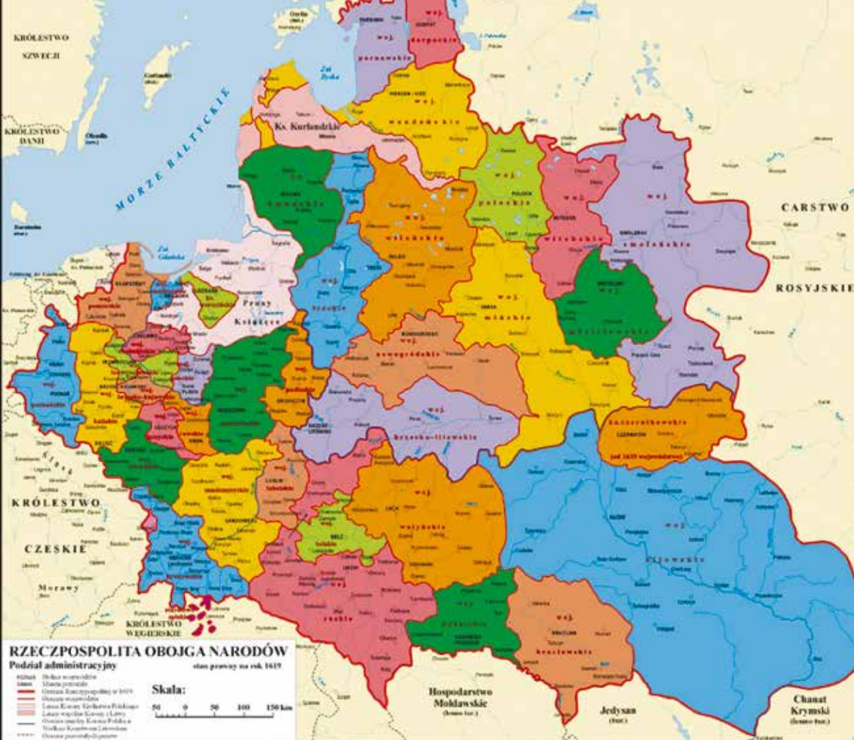
Адміністративний поділ РП. 1615 р.

на справа». «Спільна справа» трьох народів — польського, руського (тепер ми називаємо себе «українцями») та литовського. Усі вони, а також представники інших автохтонних національних груп числом кілька десятків, згідно з діючими тоді законами, були поділені на 5 соціальних верств: