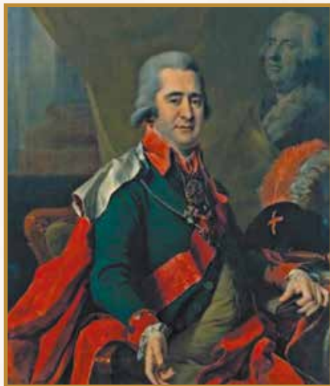
І. Безбородько. Худ. Д. Левицький. Суспільне надбання

Саме він 1820 р. заснував в м. Ніжин перший світський університет на території сучас-