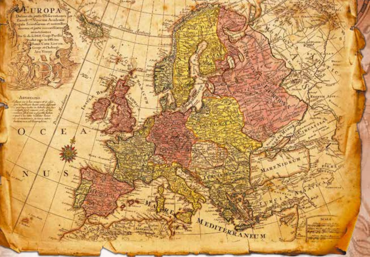
Політична мапа Європи. Поч. XVIII ст.