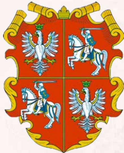
Герб Речі Посполитої

рацією Королівства Польського та Великого князівства Литовського, яка від 1569 р. назива-