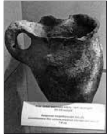
Аварська поховальна урна, VII—VIII ст., Закарпаття

Аварська держава була непогано організована. Що й забезпечило її тривале існування. Авари змусили візантійців платити собі данину. У 626 р. вони разом зі слов'янськими загонами взяли в осаду Константинополь. Правда, зазнали поразки. Після цього експансія аварів припинилася.