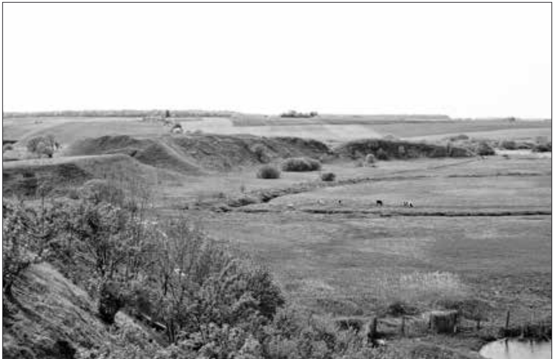
Зимненське городище, вид з боку Свято-Успенського монастиря

Авари з'явилися на теренах України, зокрема в Північному Причорномор'ї, в результаті Великого переселення народів. Про них зустрічалися згадки в творах