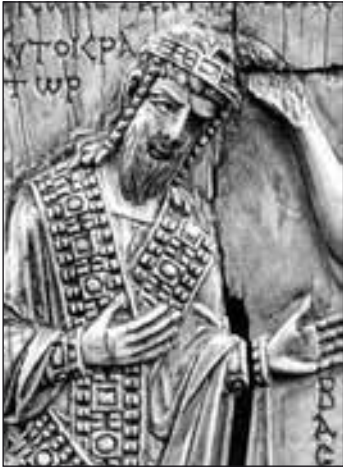
Костянтин VII Багрянородний

На теренах Аварського каганату проживало чимало слов'ян. Після загибелі цієї держави деякі з них опинилися поза межами впливів держав франків і болгар-тюрків. Саме на той час припадає створення слов'янських державних утворень. І саме на теренах, де колись панували авари.