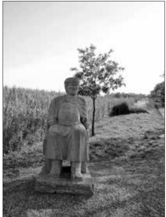
Пам'ятник Само в Дубнянах, Чехія