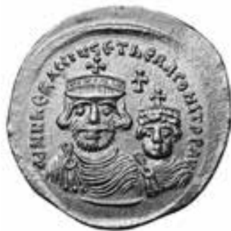
Імператор Іраклій I

У «Повісті минулих літ» при описі давніх часів читаємо наступне: «...існували й обри, що воювали проти цесаря Іраклія і мало його не схопили. Ці ж обри воювали проти слов'ян і примучили дулібів, що [теж] були слов'янами, і насильство вони чинили жінкам дулібським: якщо поїхати [треба] було обринові, [то] не да-