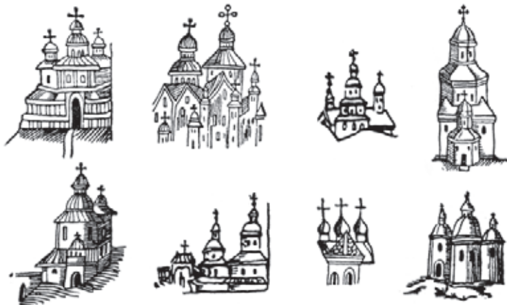
Зображення триверхих церков в українських стародруках. За В. Січинським. 1925 р.