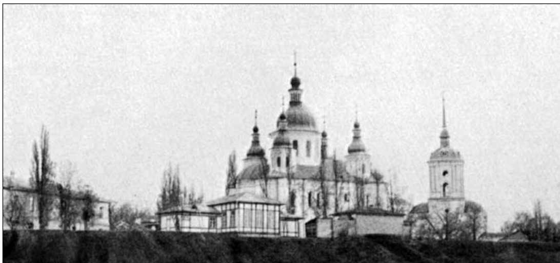
Кирилловский монастырь. Фото начала XX в. с колокольной, снесённой в советское время

К средневековому Киеву с севера вели две дороги: от городов Вышгород и Белгород. Первый ныне — райцентр совсем рядом с разросшимся Киевом, а второй — небольшое село Белогородка на реке Ирпень. Гряды высоких и крутых холмов на подступах к древнему Киеву тянутся на юго-восток, нависая над плоскими террасами и заливными лугами и всё более приближаясь к Днепру. Поселения как славян, так и их предшественников на этих местах устраивались близко к обрыву, на мысу горы, чтобы оборонительные сооружения строить только с одной стороны. На Кирилловских высотах, крайних северо-западных подступах к городу, рядом с селом Дорогожичи располо-