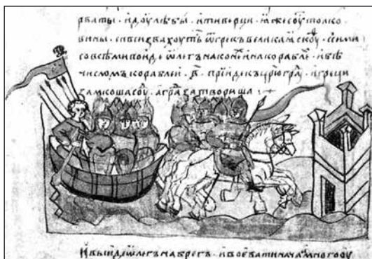
Поход Олега с дружиной на Константинополь (из Радзивилловской летописи XIII ст.)

На фоне западноевропейской истории период быстрого подъёма Киева и государства Русь совпадает с общеевропейским подъёмом, но является сравнительно кратким и обрывается задолго до того времени, когда Европа выходит на новые социально-культурные рубежи. Фернан Бродель датирует «первый период после Нового времени во Франции и в Европе» 950—1450 годами и характеризует его как «невиданное преобразование Запада». Оно оказалось, однако, слишком непрочным и завершилось упадком в середине XV века 1 . В истории Украины середина XV века также ознаменовалась довольно крутым поворотом. Но упадок, последовавший на Руси за военной катастрофой 1240 г., развёл историю Востока и Запада Европы в разных направлениях и не позволяет далее проводить прямые параллели между этими двумя линиями развития цивилизации.