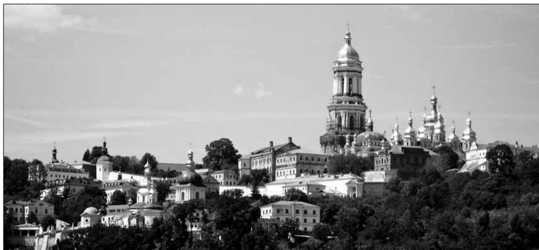
Киево-Печерская лавра. Вид с левого берега Днепра

Панорама Киева прекрасна, откуда бы не открывалась она гостю города. Особую прелесть Киеву придаёт сочетание контрастов — городской застройки с зеленью садов и лесов, подступающих прямо к городу, крутого холмистого рельефа с горизонталями площадей и прибрежных террас. Если вы едете в Киев с севера или запада, сосновый лес обрывается внезапно, открывая удивительный город в садах и парках, и даже если вы въезжаете в город из безлесного юга, вы видите, что справа за домами простирается не просто парк, а большой Голосеевский лес. Но красивее всего Киев смотрится летом из-за Днепра, с равнинного левого берега, — над покрытыми зеленью крутыми высокими холмами возвышаются золотые купола церквей, синее небо, синяя вода, непередаваемое ощущение про-