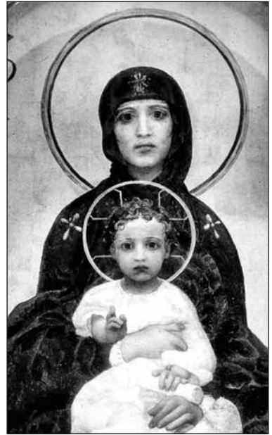
М. Врубель. «Богоматерь с младенцем». Фрагмент иконы

Здесь уже, собственно, начинался град Киев. Территория Киева — это даже не холмы, а горная страна, изрезанная оврагами. Внизу, под Горой, на равнине рядом