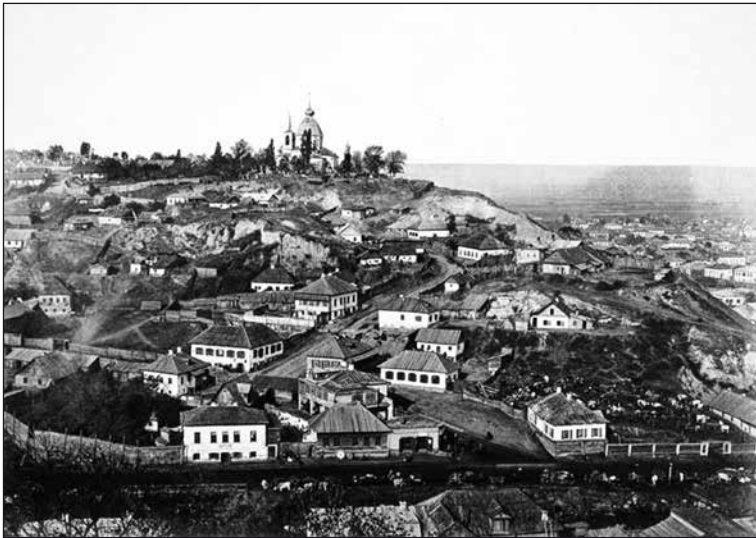
Гора Щекавица. Вид с Замковой горы.