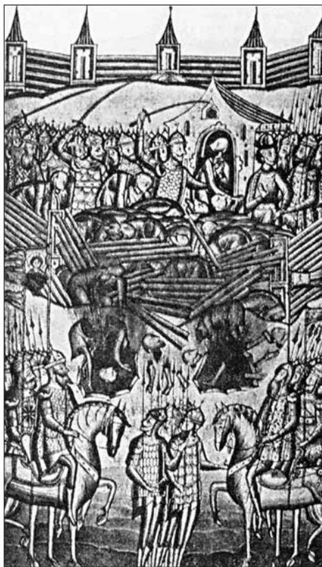
Взятие Киева монголами в 1240 году

сторона — и яркое солнце блестит в днепровских волнах. Путешественники в древности по большей части видели Киев именно с Днепра — дорог тогда было мало, и главными путями были реки. Летопись говорит, что монгольское войско, разгромив Русь на левобережье под Переяславом, вышло к Днепру — и, поражённое увиденным, не решилось штурмовать Киев. Лишь в следующем году город пал под напором войск Батыея.