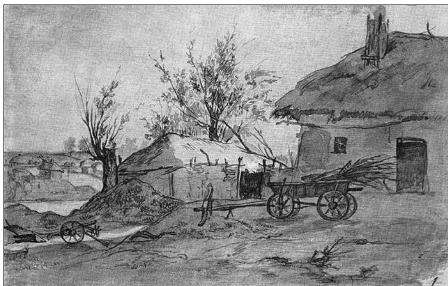
Селянське подвір'я. 1845