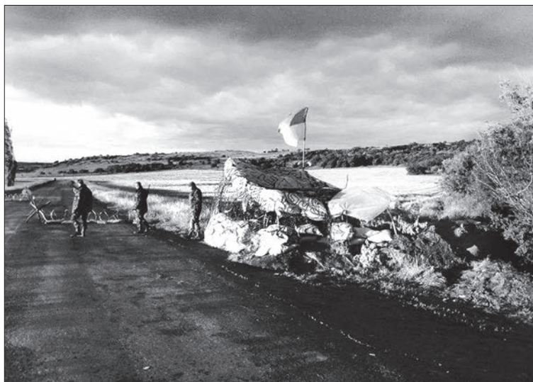
22-й блокпост батальйону «Кривбас» між Старобешевим і Новокатеринівкою.

нецькій області. Перекрита шлагбаумом дорога, мішки з піском і бетонні блоки на дорозі, які застосовувались для повільного пересування транспорту повз блокпост.