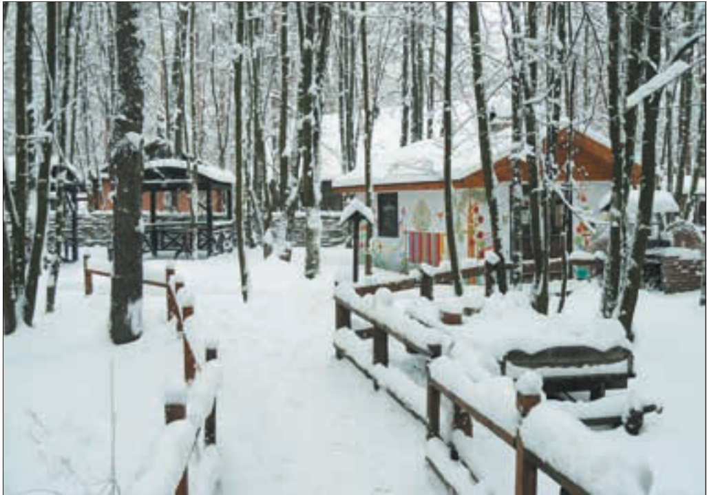
Етнографічний комплекс «Українське село»

До речі, в «Українському селі» вважають, що Масляна — це російська традиція: млинці, трійка, балалайка. А у нас це свято Колодія, завершальний зимовий цикл. Колода — символ зимового холоду, нудьги, застою та нерішучості. Її прив'язують мотузкою неодруженим па-