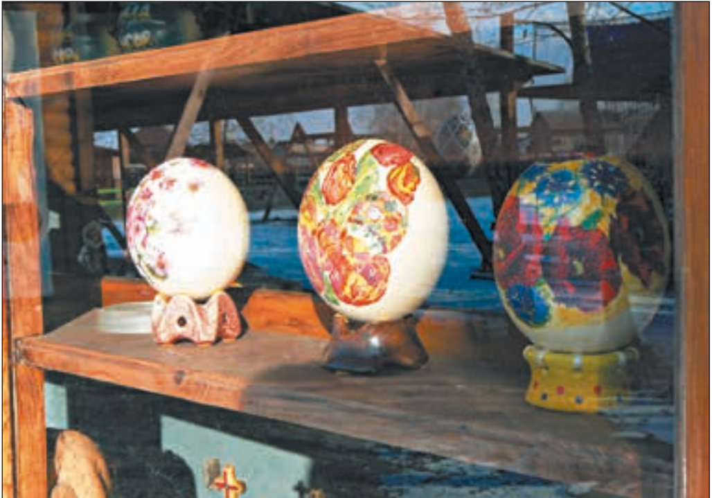
Розмальовані яйця страусів — чудовий сувенір

Яєчнею з одного страусинового яйця можна нагодувати 10—15 осіб. Шкаралупу при цьому не розбивають, а використовують для виготовлення сувенірів — оформляють у техніці декупажу, розписують, прикрашають різьбленням. Ціна сувенірного яйця залежить від складності роботи.