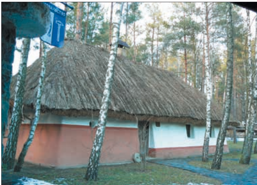
Хата з нахиленими стінами. Саме вона зображена на логотипі комплексу

Етнічний ресторан і готельні будиночки — це лише частина великого етнографічного комплексу «Українське