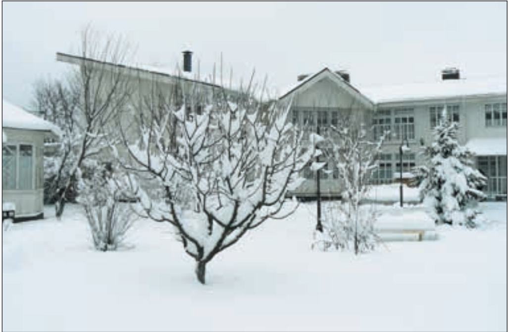
Ресторан «Бабусин сад»