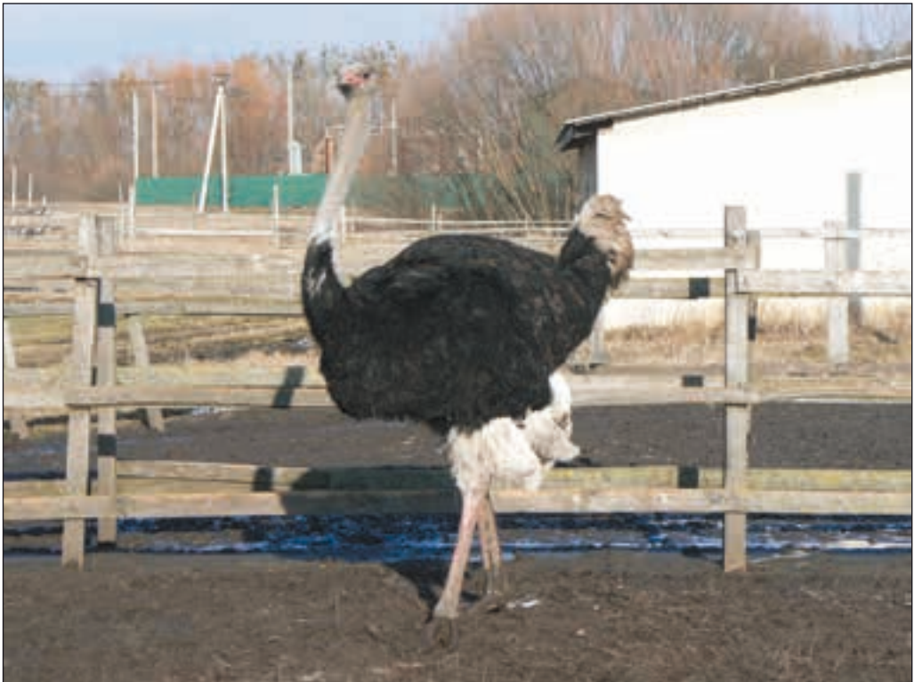
Саме на таких страусах і катаються гості

Якщо погода не підводить, то тут на свято буває більше тисячі гостей. Адже за довгу зиму багато хто встигає скучити за природою. Так, на Масницю варто вибра-