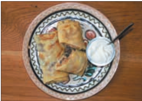
Млинці з куркою

Народний ансамбль із піснями і танцями, а також спеціальне млинцеве меню