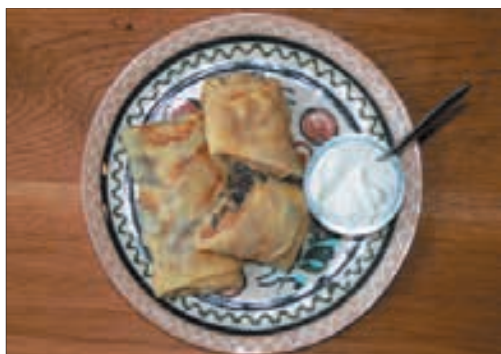
Naleśniki z kurczakiem

Zespół folklorystyczny z pieśniami i tańcami, a także specjalne menu naleśnikowe o siedmiu pozycjach to tradycyjny program święta Maślenicy w restauracji Babusyn Sad (Ogród Babci). Zakład w