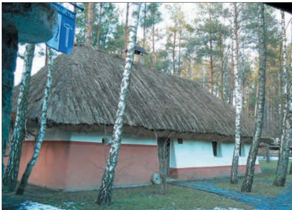
Chata o spadzistych ścianach. Właśnie ona jest przedstawiona na logo zespołu.

Jeśli gdzieś w okolicach Kijowa wiedzą wszystko o ukraińskich tradycjach, to w Buzowej. To trochę dalej po drodze. Lodowata i zamieciona, ale mimo tego przejezdna droga wiejska odbija z trasy żytomierskiej i prowadzi do spółdzielni działkowej „Buzok” na skraju lasu. Między pokrytymi świeżym śniegiem sosnowymi gałęziami można zobaczyć kopułę drewnianej cerkwi-rotundy Św. Dymitra z Thesalonik. Wokół znajdują się wiejskie chaty i szopy w różnych kształtach. Kwaczą kaczki nad jeziorem, beczą owce w koszarach, stukają młotkiem w kuźni. Wydaje się, że jeśli opady śniegu nagle odetną to miejsce od cywilizacji, to tutaj jest wszystko aby przeżyć zimę: woda ze studni, autonomiczna kanalizacja, paliwo rośnie samo, zapasów jedzenia wystarczająco dużo, w tym można się przekonać, zaglądając do przyjemnie pachnącej koliby.