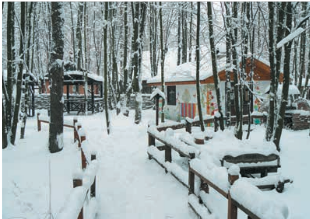
Zespół etnograficzny „Ukraińska wieś”

Przy okazji, w „Ukraińskiej wsi” wierzą, że Maślenica jest tradycją rosyjską: naleśniki, trojka, bałajka. Nasze święto — to święto Kołodija, kończące cykl zimowy. Kłoda jest symbolem zimowego zimna, nudy, stagnacji i niezdecydowania. Przy-