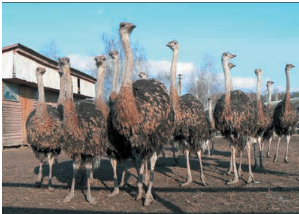
Gospodarstwo „Dolina Strusi”

Osiem lat temu nowi właściciele zwyczajnej hodowli kurczaków postanowili przekształcić ją w zespół rozrywkowy z restauracją,