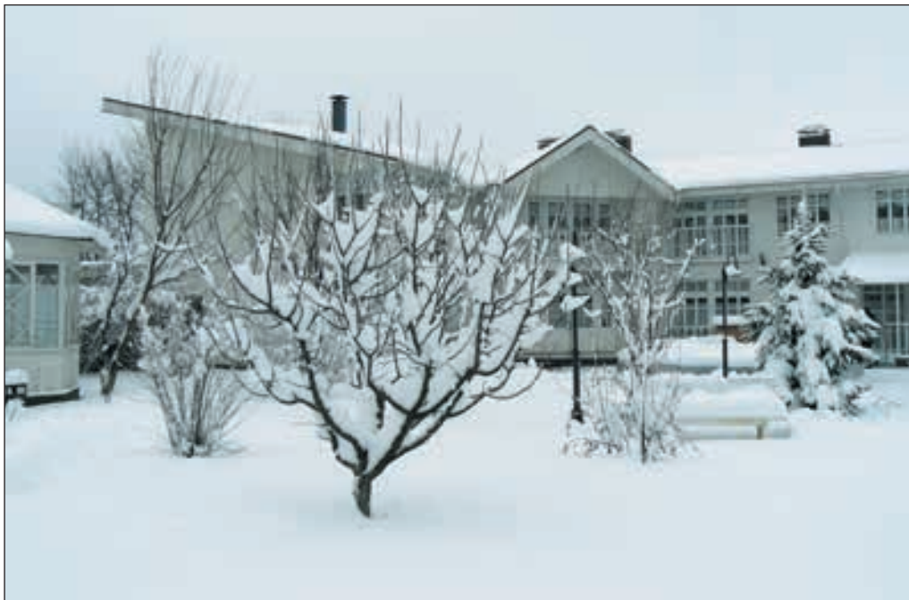
Restauracja Babusyn Sad (Ogród babci)

rogatkach miasta występują korki. Od Buzowej do Jasnohorodki jest trasa bezpośrednia po drogach wiejskich, ale zimą lepiej jest zrobić mały objazd przez Mriję i Łyczankę.