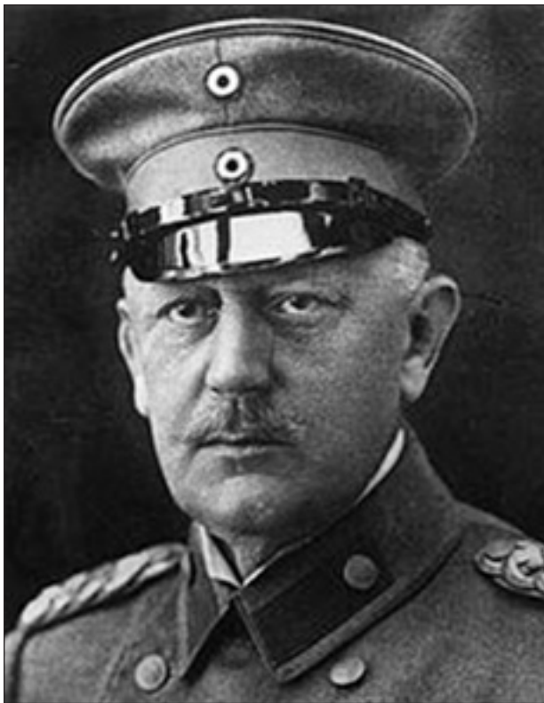
Гельмут Мольтке (молодший). Начальник німецького Генштабу у 1906—1914 рр.

Після 1907 р., з приєднанням Росії до Антанти, німці повинні були враховувати, що їх сили і сили Австрії разом значно по-