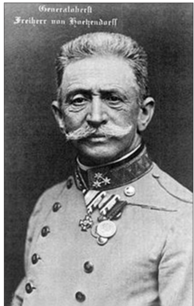
Франц Конрад фон Гетцендорф — начальник Генерального штабу збройних сил Австро-Угорщини.

Відповідно плану передбачалось розгортання австро-угорських сил загальною кількістю близько 1100 батальйонів піхоти. Воно мало проходити у трьох оперативних ешелонах. Плануючи наступ, начальник австро-угорського Генштабу робив ставку на