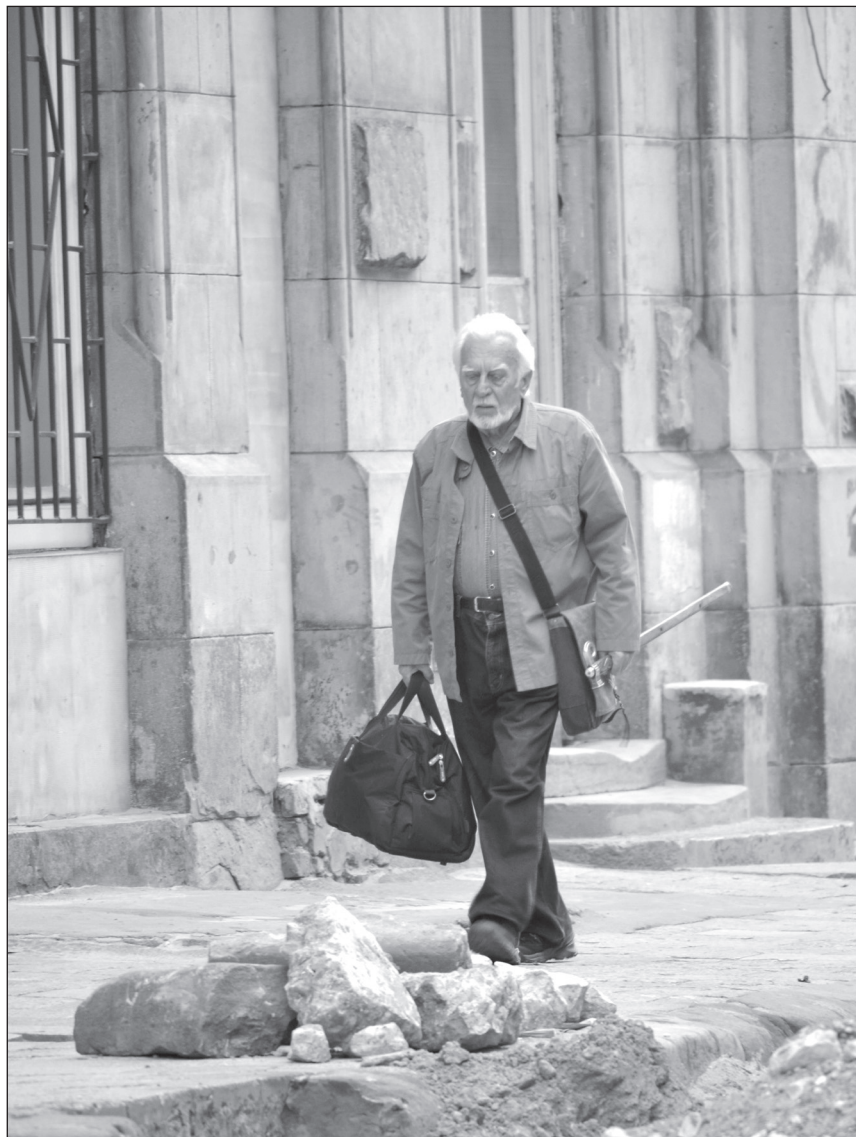
Львів, серпень 2012 р.