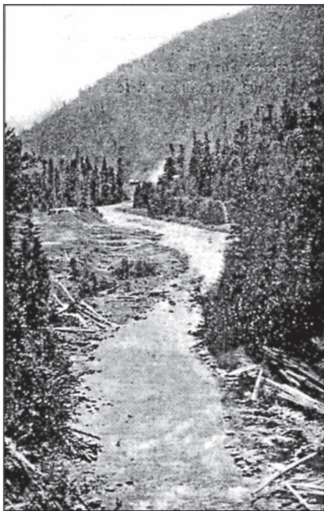
4. Гук на Грамівнім великим.

складає ся з двох рік: східної, Білої р. і західної, Чорної р. Головний жерельний потік Білого Черемошу називає ся Перкалаб ; його жерело бе під самою угорською границею на східних склонах г. Палениці. Сім км. понизше свого жерела лучить ся Перкалаб з потоком Саратою , а дальше з п. Єловічора , що впливає в Буковинських горах; аж відси має ся ріка