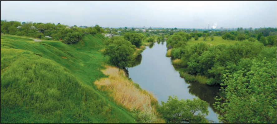
Донецьке городище. Околиця Харкова

Та як же так? Невже наше місто таке молоде? Усього 365 років! Звісно ж, і в Україні, і в світі є міста набагато давніші — на сотні й навіть тисячі років. А давніше місто — давніша і його історія, отже, більше нагод ним пишатися.