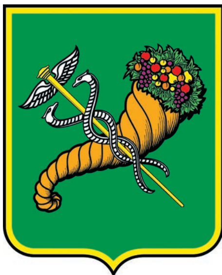
Сучасний герб Харкова

Здавалося б, наука, зокрема й історична, знає чимало. Але, на жаль, не все. Коли з'явилося в заплавіні п'яти річок — Лопані, Харкова, Уд, Немишлі (Немишлянки) й Нетечі — місто Харків?