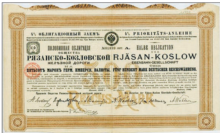
Акція Рязансько-Козловської залізниці

Будівництво російських залізниць обіцяло прибутки тим інвесторам, що були готові повірити в гарантії царського уряду. Ідеологом такого фандрейзингу став Павло фон Дервіз. Схема була зрозумілою, однак невігдною для державної скарбниці. На іноземних грошових ринках розміщували облігаційні позики приватних товариств під забезпечення