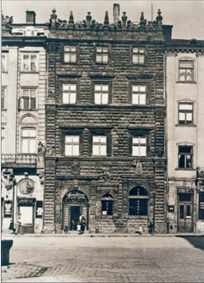
Фотографія Чорної кам'яниці 1930-х років (А. Лінкевич)

Чорну кам'яницю , яка захоплює увагу глядача завдяки своєму магічному чорному забарвленню. Ніхто не збирався будувати її такою похмурою в яскраві часи ренесансу (за таке можна було і поплатитись!), але пористий за своїми властивостями пісковик, з якого вона постала наприкінці XVI століття, з часом почав забиватися брудом, пилом, піддавався атмосферному впливові і набув неохайного вигляду. І тоді будинок почали підфарбовувати на темний брунатний колір. Хоча інша версія говорить, що потемніння кам'яниці є наслідком окислення свинцевих білil, якими ґрунтувався фасад перед