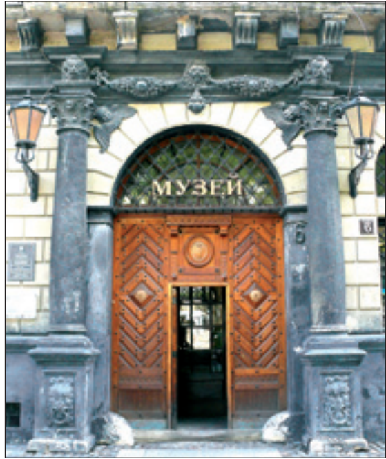
Портал Королівської кам'яниці

знавець східних мов, дипломат, чоловік із великою кількістю зв'язків на Сході, він одразу став незамінним спочатку при дворі короля Сигізмунда II Августа, який дарував йому дворянство, а потім і при Стефані Баторії, який підтвердив надання дворянства і дозволив збудувати розкішну будівлю на шість вікон. Вхід до кам'яниці Корнякта, без перебільшення, можна назвати справжнім порталом переміщення в часі та просторі. Пройшовши через важкі старовинні двері, повз готичну залу, яку тепер займає антикварна крамничка, ви потрапите на чудове Італійське подвір'я кінця XVI століття, рівного якому немає в Україні. Італійським його названо тому, що будували його італійські зодчі. Саме такими ренесансними подвір'ями можна милуватись у Флоренції, Римі, Венеції. Замкнутий простір з розкинутим угорі шатром львівського неба, колонада відкритих лоджій із копіями граційних скульптур видатних майстрів епохи Відродження — усе це