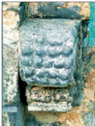
Завиток-стілець біля входу до Чорної кам'яниці

Чорну кам'яницю , яка захоплює увагу глядача завдяки своєму магічному чорному забарвленню. Ніхто не збирався будувати її такою похмурою в яскраві часи ренесансу (за таке можна було і поплатитись!), але пористий за своїми властивостями пісковик, з якого вона постала наприкінці XVI століття, з часом почав забиватися брудом, пилом, піддавався атмосферному впливові і набув неохайного вигляду. І тоді будинок почали підфарбовувати на темний брунатний колір. Хоча інша версія говорить, що потемніння кам'яниці є наслідком окислення свинцевих білil, якими ґрунтувався фасад перед