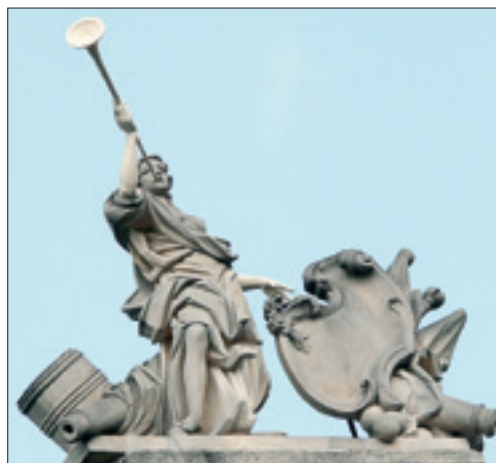
Скульптура Глорії вгорі Вільчківської кам'яниці