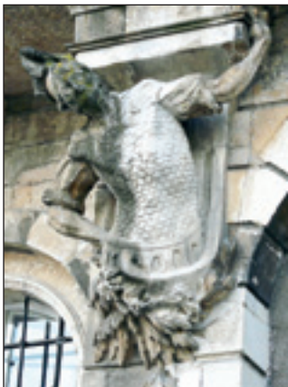
Консолі балкона на кам'яниці № 3

У майже вітражному барвістому оздобленні площі Ринок є і своє всепоглинаюче чорне скельце. Мова про кам'яницю № 4 , а бо