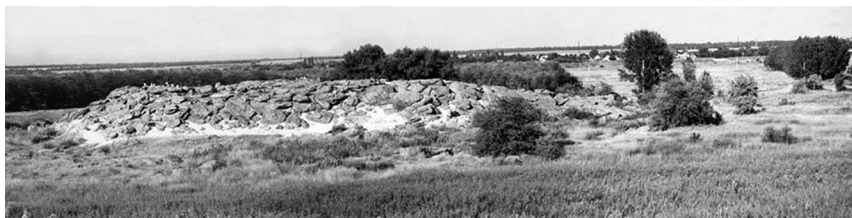
Заповедник «Каменная Могила»

Самой интересной археологической памяткой о жизни древних жителей Украины является Каменная Могила, которая находится неподалеку от села Терпенье Мелитопольского района Запорожской области. Она представляет собой песчаный холм, покрытый крупными каменными глыбами, в которых имеется множество гротов, пещер и трещин.