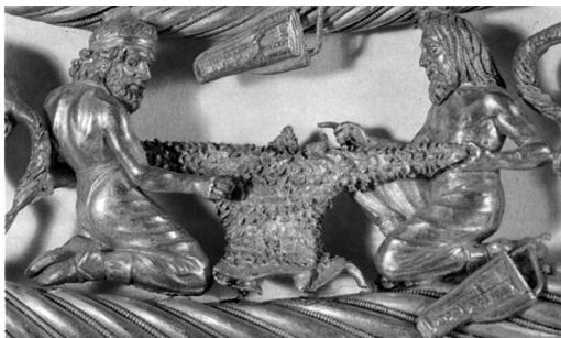
Золотая пектораль из скифского кургана Толстая Могила. Фрагмент пекторали