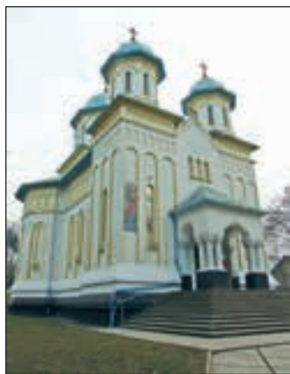
Петропавлівська церква на вул. Сторожинецькій

вул. Суворова, 6 (1934), Петропавлівська гарнізонна церква по вул. Сторожинецькій (1938) тощо. Такий розквіт національного стилю стає зрозумілим, якщо знати історію: у міжвоєнний період Румунія була досить заможною державою завдяки багатим покладом нафти поблизу міста Плоешті.