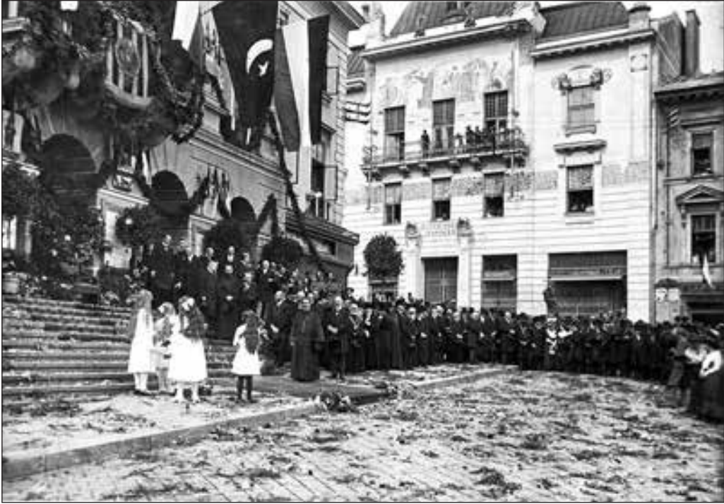
Зустріч імператора Австро-Угорщини Карла I у Чернівецькій ратуші 1916 р.

ребуває 2,5-тисячний полк легіону Українських січових стрільців.