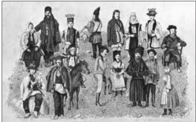
Народи, що населяють Буковину. Стара листівка

1849 р. — Буковина отримує автономію від Галичини. Тепер це