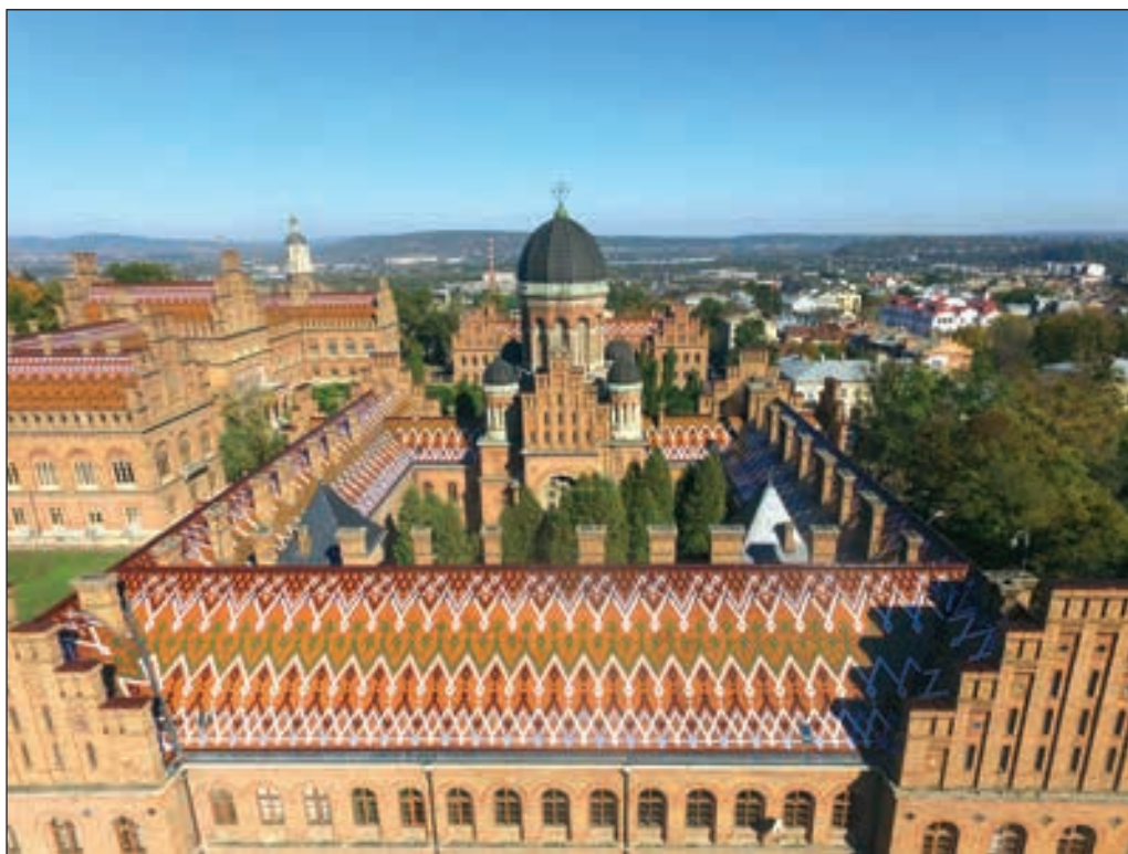
Головна архітектурна гордість міста — Резиденція буковинських митрополитів

ції. Коштовностей у скрині чимало, і вони такі різні. Genius loci, геній місця у Чернівцях говорить півдужиною мов та незле розбирається в архітектурних стилях. Бо тут є майже все: від козацького бароко монастирської церкви на Горечі до неоготики єзуїтського костелу; від скромних буковинських хатніх церков — до показної розкоші віденської сецесії; від декоративності бринковяну (румунського Відродження) до помпезності класицизму. Німецький фахверк?