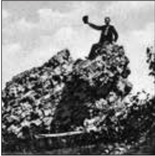
Рештки замку на горі Цецино. Початок XX ст.

темника Бурундая. Рештки фортеці залишалися на горі навіть в радянський час — про ці розвалини літописець Чернівців Раймунд Кайндль писав: «...кам'яні стіни, які не піддаються століттям». У 1959 р. на їхньому місці поставили чернівецьку телевишку. Піддалися-таки.