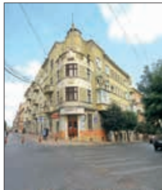
Будинок на вул. Кобилянської у стилі функціоналізму

У Чернівцях є як приклади рядової забудови у стилі функціоналізму, так і маленькі шедеври — колишній Румунський дім на Театральній площі, будинок Залозецького на вул. Кобилянської, 31, приміщення чернівецького аеропорту (зараз сильно модернізоване) чи міська поліклініка № 8 на вул. Шкільній, 8, яка розмістилася у екс-Будинку соціального страхування. Чудові зразки сти-