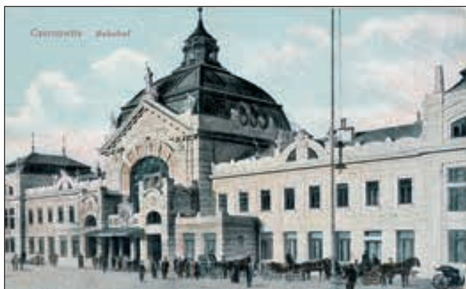
Чернівецький вокзал. Стара листівка