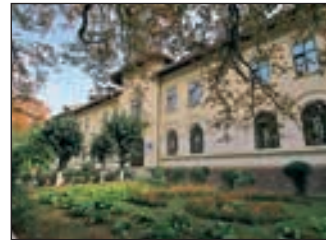
Гімназія № 3 — зразок архітектури у стилі бринковяну

стилі — перший зустрічає гостей міста відразу напроти залізничного вокзалу (вул. Гагаріна, 23, колишній «Дім праці», 1927). А ще це і «попівський будинок» у сквері біля Резиденції, і вілли на вул. Чорноморській, багатоквартирні будинки № 81 на Головній; № 31 на Гагаріна (1938), гімназія № 3 на Головній; 131а, дитячий садок «Горобинка» по вул. Петергофській, колишній Палац прикордонників, а зараз житловий будинок на