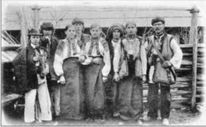
Русини Буковини на старій листівці