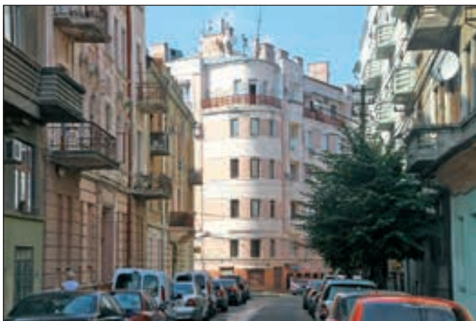
Панорама вулиці Української