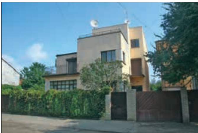
Вілла у стилі функціоналізму на вул. Гребінки