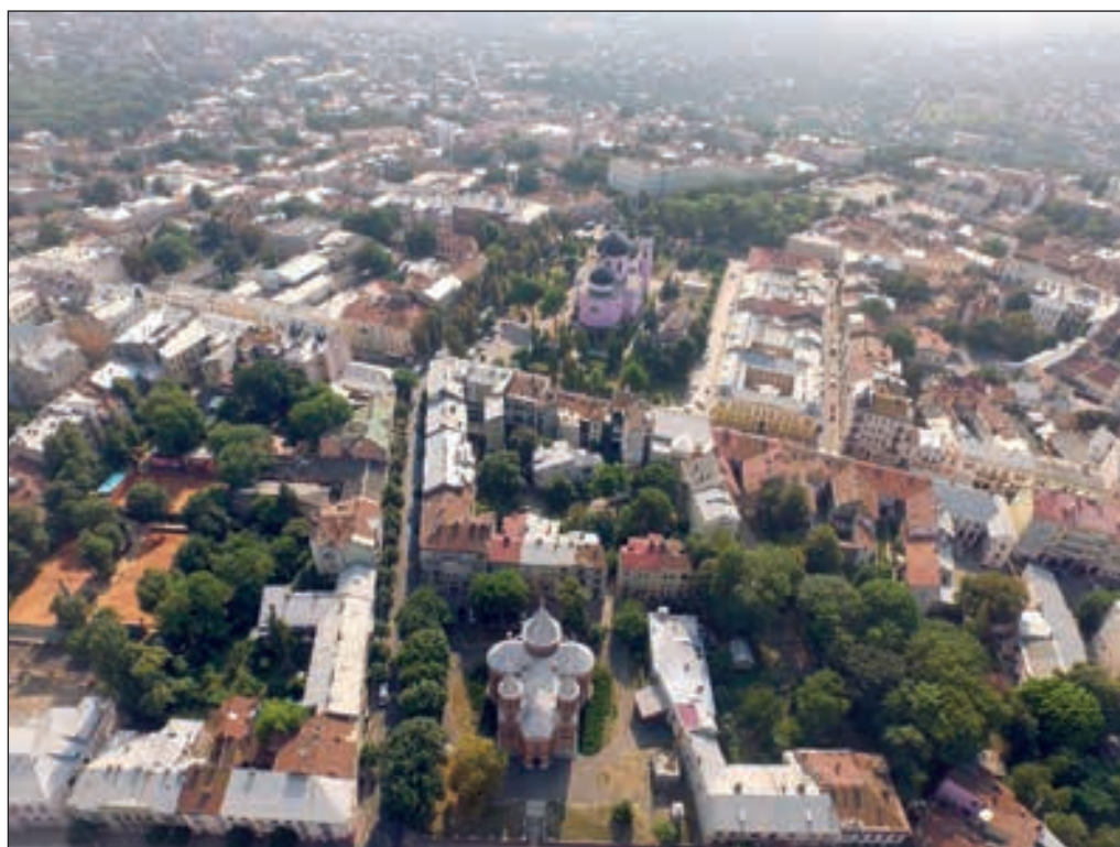
Вулиця Кобилянської та квартали навколо неї з пташиного лету

II половина XII ст. — на високій горі Цецин (538 м над рівнем моря) за наказом галицького князя Ярослава Осмомисла з'являється укріплення Черн. Цей дитинець згадується у «Списку городів руських дальніх і ближніх». Поселення, яке пізніше виникло під горою, назвало себе за іменем фортеці. Самі ж укріплення були зруйновані у 1259 р. на вимогу татарського