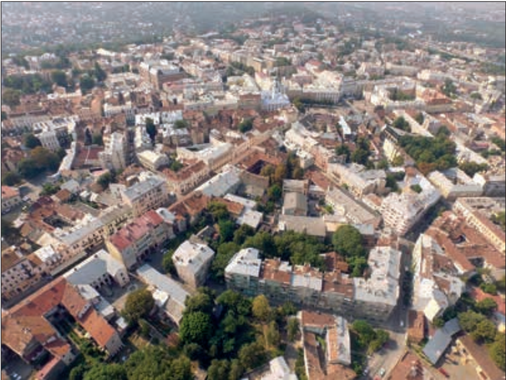
Середмістя Чернівців з пташиного лету

та вірмени. Піддайтеся абсолютно природному бажанню зануритися у цю скриню з головою, щоб потім довго зачаровано вивчати її скарби: червону вірменську церкву, блакитну ратушу, потемнілу від дощів Миколаївську дерев'яну церкву, різнокольорову вулицю Кобилянської, позеленілу мідь шпиля на костелі Серця Ісуса. І головний діамант колекції — Резиденцію митрополитів Буковини та Далма-