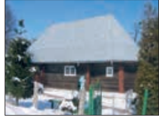
Успенська церква хатнього типу

1538 р. — Чернівці потрапляють під турецьке ярмо і занепадають. Життя тут ледве жевріє. У 1762 р. у майбутній столиці герцогства Буковина налічувалося всього 200 дерев'яних хат ідесь 1200 мешканців. Турецький період залишив свій слід у вигляді кількох дерев'яних церков хатнього типу, що збереглися у місті. Османи не дозволяли бу-