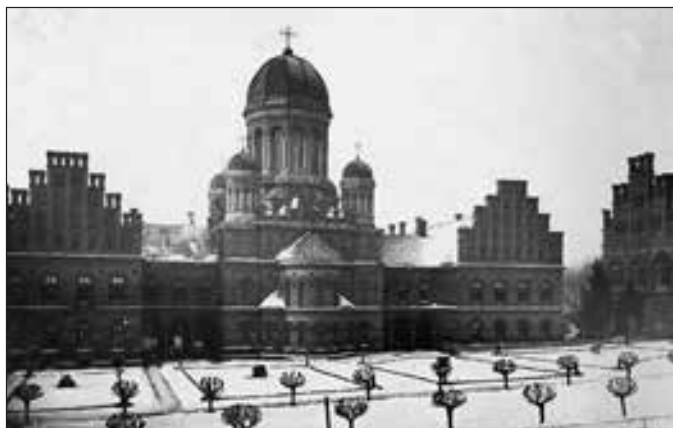
Митрополича резиденція. Архівна світлина