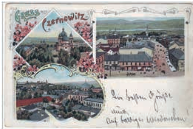
Колажі Gruss aus Czernowitz — популярний мотив на старих поштівках

Чернівчани часом називають своє місто островом, не без певної долі розпачу натякаючи, що дістатися сюди потягом чи літаком не так вже й просто. Квитки часто в дефіциті. Дороги — вічна і болюча тема для Буковини, але в 2018 р. стан дорожнього покриття на трасі Н-03 (Житомир—Чернівці) значно покращився.