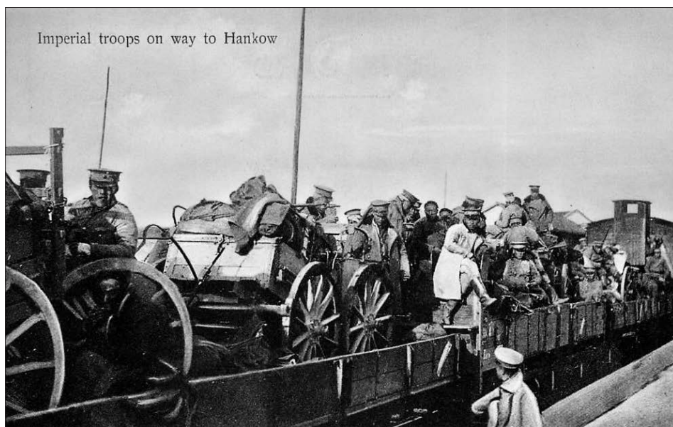
Отборные императорские войска — Бэйянская армия — направляется в Ханькоу для подавления стихийного восстания на юге страны.

Ссылка генерала проходила в его родной деревне — и казалось, ни в какие государственные дела он не вмешивался, но контакты с военными поддерживал очень плотные. Из семи командиров дивизий Новой Армии пятеро были ему лично сильно обязаны. А Бэйянская армия де-факто оставалась полностью ему подконтрольна. После начала Уханьского восстания 10 октября 1911 года правительство в Пекине было сильно напугано. Южные провинции объявляли о своей независимости одна за другой. Север сомневался. В сомнениях и неопределенности пребывали также военные. Бэйянская армия в сложившейся ситуации оказалась единственной реальной силой в стране, способной подавить восстание на юге и прекратить таким образом волнения в Китае. Дабы заставить армию идти в бой за династию Цин, следовало заручиться поддержкой Юань Шикая. Черда восстаний выбросила генерала на гребень истории меньше чем за месяц, и уже 27 октября