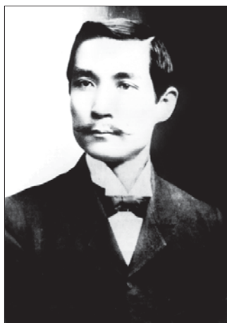
Доктор Сунь Ятсен — китайский революционер, основатель партии Гоминьдан, ныне почитаемый в Китае как «Отец нации», 1900 год.

Китай того времени являлся страной разрозненной и расколотой, во многом крайне отсталой. Из населения почти в 400 миллионов человек лишь немногим более 100 тысяч посещали среднюю школу, около 2 миллионов обучались в школе начальной. Грамотными среди мужчин были не более 30 процентов, а среди женщин этот показатель достигал всего лишь 5 процентов.