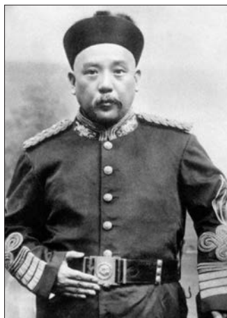
Юань Шикай — командующий Бэйянской армией и президент Республики Китай с 1912 по 1915 год.

Ссылка генерала проходила в его родной деревне — и казалось, ни в какие государственные дела он не вмешивался, но контакты с военными поддерживал очень плотные. Из семи командиров дивизий Новой Армии пятеро были ему лично сильно обязаны. А Бэйянская армия де-факто оставалась полностью ему подконтрольна. После начала Уханьского восстания 10 октября 1911 года правительство в Пекине было сильно напугано. Южные провинции объявляли о своей независимости одна за другой. Север сомневался. В сомнениях и неопределенности пребывали также военные. Бэйянская армия в сложившейся ситуации оказалась единственной реальной силой в стране, способной подавить восстание на юге и прекратить таким образом волнения в Китае. Дабы заставить армию идти в бой за династию Цин, следовало заручиться поддержкой Юань Шикая. Черда восстаний выбросила генерала на гребень истории меньше чем за месяц, и уже 27 октября