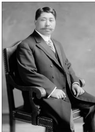
Хуан Син — ближайший соратник Сунь Ятсена в организации Тунмэнхой, революционер-милитарист, впоследствии первым возглавивший армию Китайской республики.

Однако вернемся к событиям в Ухане. После стремительной победы восстания и захвата всей территории трехградья, составными частями которого являются города Учан, Ханькоу и Ханьян, императорское правительство в Пекине отдало приказ верным воинским частям подавить мятеж. В бой бросили лучшие войска империи Цин — отборную Бэйяньскую армию. Подразделения армии, дислоцированные в основном на севере Китая, неподалеку от Пекина, доставили в Ухань по железной дороге. Наступление началось 18 октября. К концу ноября правительственные войска почти полностью выбили восставших из Уханя. И в этот момент события приобрели крайне необычный и исключительно политизированный характер: командующий Бэйяньской армии перешел на сторону революции в обмен на пост президента будущей республики. Юань Шикай, некий эквивалент китайского Наполеона, вышел на политическую арену, когда судьба императорского Китая повисла на тончайшем волоске, который ему и было суждено перерезать. Юань Шикай происходил из военной семьи, его родители во время Тайпинского восстания превратили родную деревню в настоящий и сильно укрепленный военный форт. Деревню даже