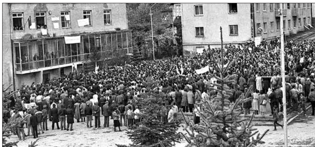
Митинг в городе Ленингори в «Южной Осетии». 1989 год