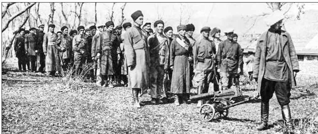
Борцы за советскую власть. Цхинвали, 1920 год

Усилиями 11-й армии РККА в 1921 году была захвачена Грузия, в апреле 1922-го создана Юго-Осетинская автономная область. Так большевики начали сочинять новую «богатую историю» кударцам — жителям предгорий, говорящих на кударском диалекте осетинского языка. Несмотря на авто-