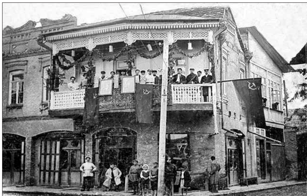
Большевики захватили Цхинвали. 1921 год