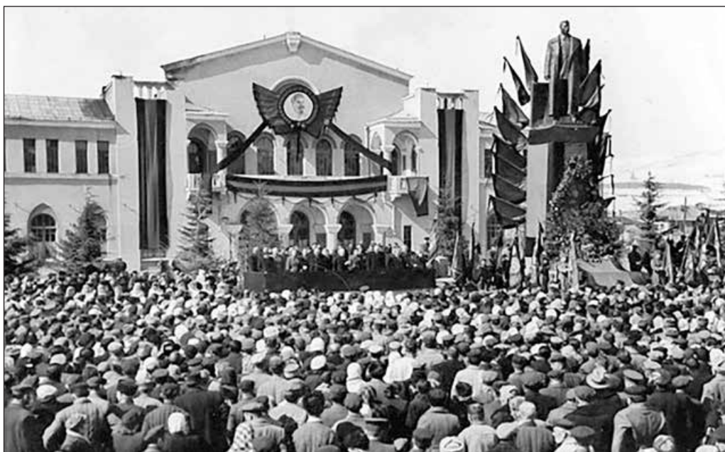
Траурный митинг по поводу смерти Сталина. Цхинвали, март 1953 года

После событий 9 апреля 1989 года российские власти поняли, что они окончательно теряют Грузию, и, чтобы ее сохранить хоть в каком-нибудь составе, решили пойти на шантаж — инициировать сепаратизм в Абхазии и Цхинвали. 10 ноября того же года Совет народных депутатов Юго-Осетинской автономной области Грузинской ССР принял решение о ее преобразовании в автономную республику. Верховный Совет Грузинской ССР признал это решение неконституционным. В результате стычек между участниками акции, приехавшими из Тбилиси, осетинами и милицией 27 человек получили огнестрельные ранения и 140 были госпитализированы. 20 сентября 1990 года Совет народных депутатов Юго-Осетинской автономной области провозгласил Юго-Осетинскую Советскую демократическую республику в составе СССР, была принята Декларация о национальном суверенитете. Более того, на чрезвычайной сессии Совета народных