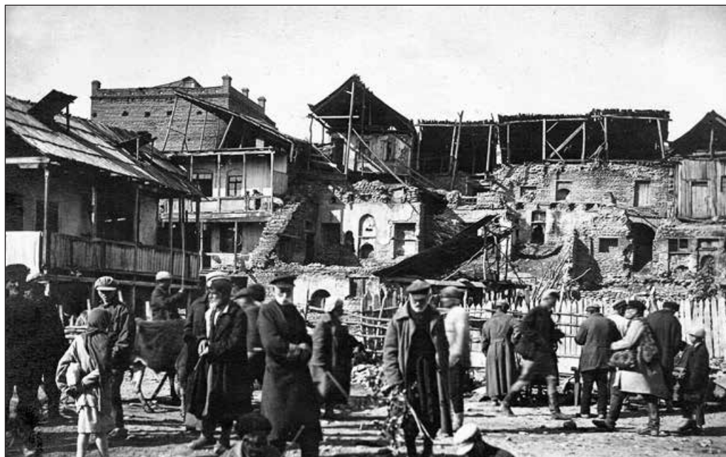
Цхинвали, еврейский квартал. 1920-е годы