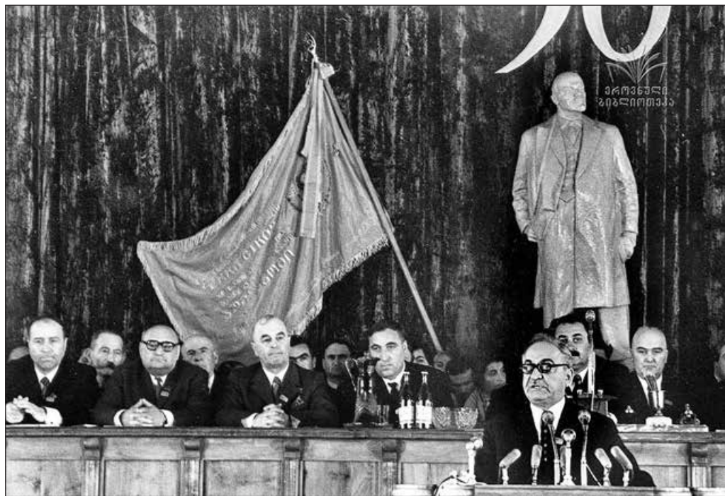
Торжественное собрание в честь 50-летия Юго-Осетинского автономного округа, на трибуне — Первый секретарь ЦК Компартии Грузии Васил Мжаванадзе. Цхинвали, 20 апреля 1972 года.