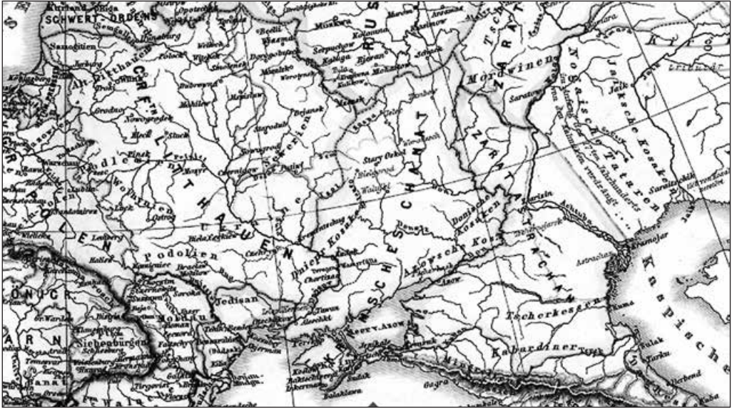
Кримський ханат. 1550 р. Суспільне надбання