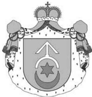
Герб роду Острозьких. Суспільне надбання