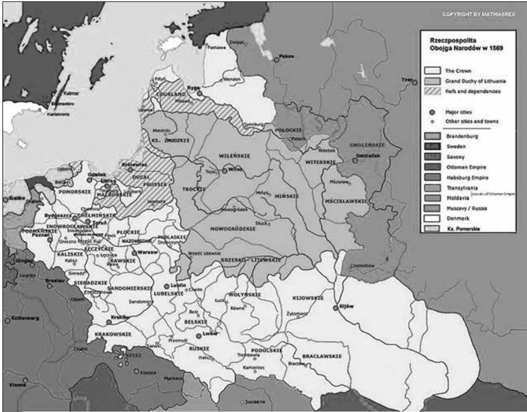
Річ Посполита Обох Народів. 1569 р. Суспільне надбання

до верстви «благородних». Наступне, XVI століття стало століттям кардинальних змін. 1569 р. у Любліні було укладено унію, яка створила «двоєдину державу двох народів» — Річ Посполиту, що об'єднала литовців, поляків та русинів. З точки зору права Люблінська унія «була актом цілком парламентарним, який ухвалено на законодавчій основі за відповідною згодою послів, котрих обирала українська (насправді руська. — Д. Я.) шляхта, єдиний правоспроможний стан тогочасного суспільства». Одним з головних наслідків створення єдиної держави було скасування державного кордону між ВКЛ та РП 1 . Це, в свою чергу, мало наслідком «зняття заборони мешканцям Корони набувати маєтки на колишній литовській частині України (тобто Русі. — Д. Я.), відкрило двері польському елементу <...> на ще не освоєні землі півдня та сходу. <...> Чималі маси шляхти <...> переміщуються з Волині на Київщину та Брацлавщину <...>», причому руські пани «вже нічим не вирізнялись від загальної лави «братії шляхетської».