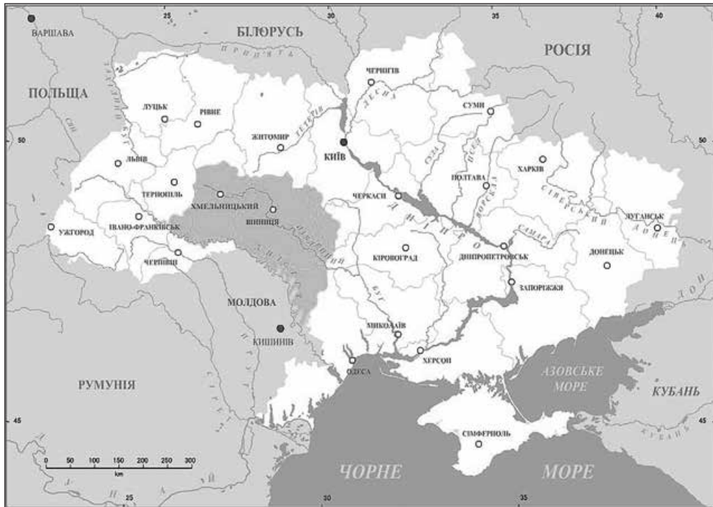
Брацлавщина. Суспільне надбання