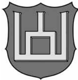
Герб засновника династії Гедиміна (т. зв. Гедимінові стовпи).