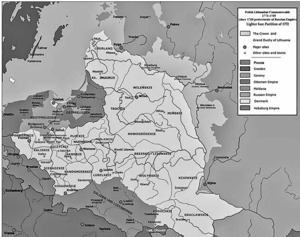
Річ Посполита в кордонах 1772 р. Суспільне надбання

Адекватну узагальнену картину малює Н. Яковенко 1 . Авторитетна дослідниця констатує: станом на початок XIV ст. головними «столами» Південно-Західної Русі — володимирським, галицьким та київським — володіли князі з двох родів: руського, Рюриковичів та литовського, Гедиміновичів. 1340 р. володимирський стіл «унаслідок династичних зв'язків посів син Гедиміна Любарт, одружений з донькою володимирського князя Андрія Юрійовича (Романовича)». Внаслідок успішних воєнних дій проти Орди в 50-х — на початку 60-х років XIV ст. Гедиміновичі утвердили-