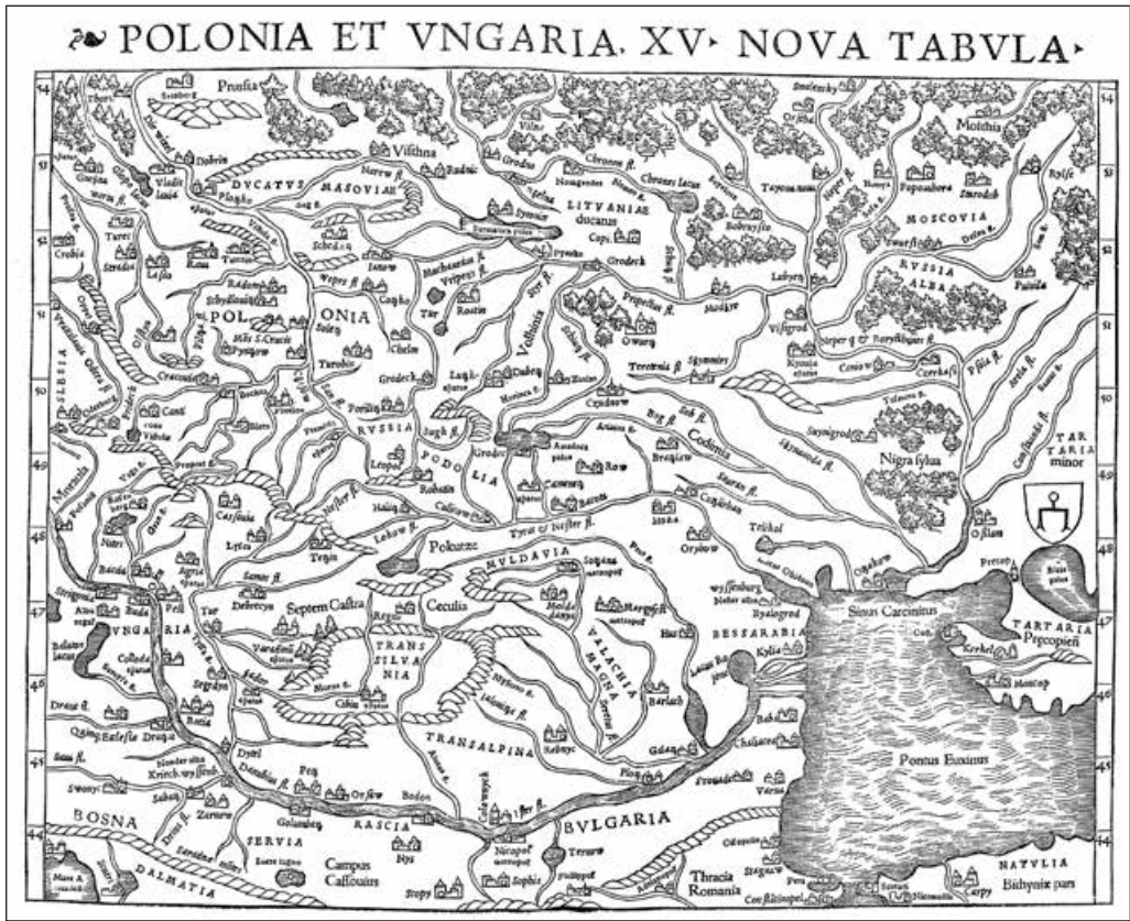
«POLONIA ET VNGARIA XV NOVA TABVLA» («Нова карта Польщі та Угорщини»). 1540 р. Чи не вперше присутні регіональні назви земель: Volhinia (Волинь), Rokutze (Покуття), Rvssia (Русь), Львів (Leopol), Podolia (Поділля), Codimia (Кодимія), Bessarabia (Бессарабія), Tartaria minor (Мала Татарія), Tartaria Przescoren (Перекопська Татарія).