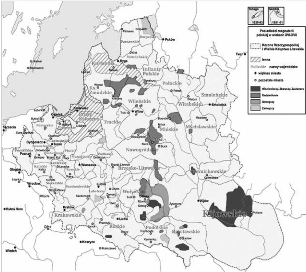
Володіння магнатів Речі Посполитої, в т. ч. Вишневецьких у XVI—XVII ст. Суспільне надбання