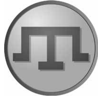
«Тамга» — знак роду Гераїв. Суспільне надбання

Саме князівська верства була реальною владою на території сучасної Західної та Центральної України, «проти яких і уряд, і король, і сейм