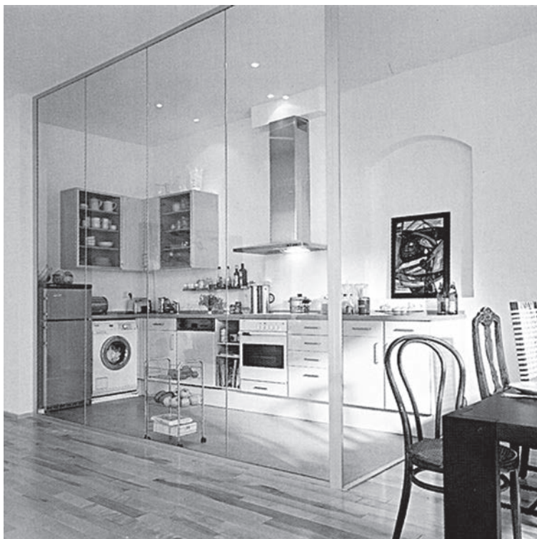
Рис. 3. Стеклопанель в кухне

ет применение необычного сочетания крашеного дерева и искусственного камня. Основная поверхность отделана камнем, и только в уголке отдыха, там, например, где размещены телевизор или камин, уложены светлые доски. Они клином врезаются в каменное поле. Обеденную группу можно выделить ярким покрытием или, наоборот, теплого цвета ковром.