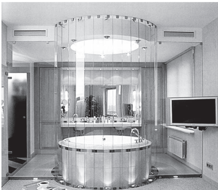
Рис. 1. Объединенное пространство ванной и спальни. Композиционным центром является круглая ванна, она отделена от кровати стеклянной перегородкой сложной формы

мебелью и другими специфическими кухонными деталями: вытяжкой, холодильником и прочей современной облегчающей жизнь кухонной начинкой, которые по форме своей ближе к хай-теку. В противовес «холодной» кухне столовую стоит сделать «теплой», уютной, с красивым, можно дощатым, полом, деревянной мебелью, благородных оттенков текстилем и прочими душевными мелочами в стиле «дом, милый дом», символизирующими уют и стабильность (см. рис. 3).