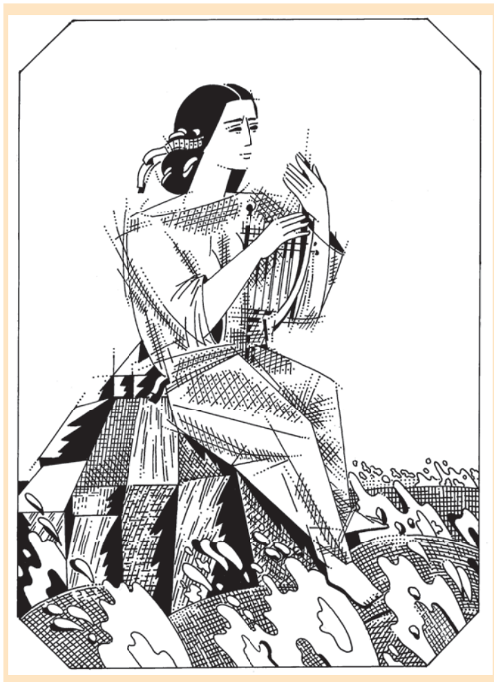
Б. Пікулицький. Ілюстрація до вірша «Сафо»

Лукавих людей, і кохання, І зраду, печаль своїх літ,