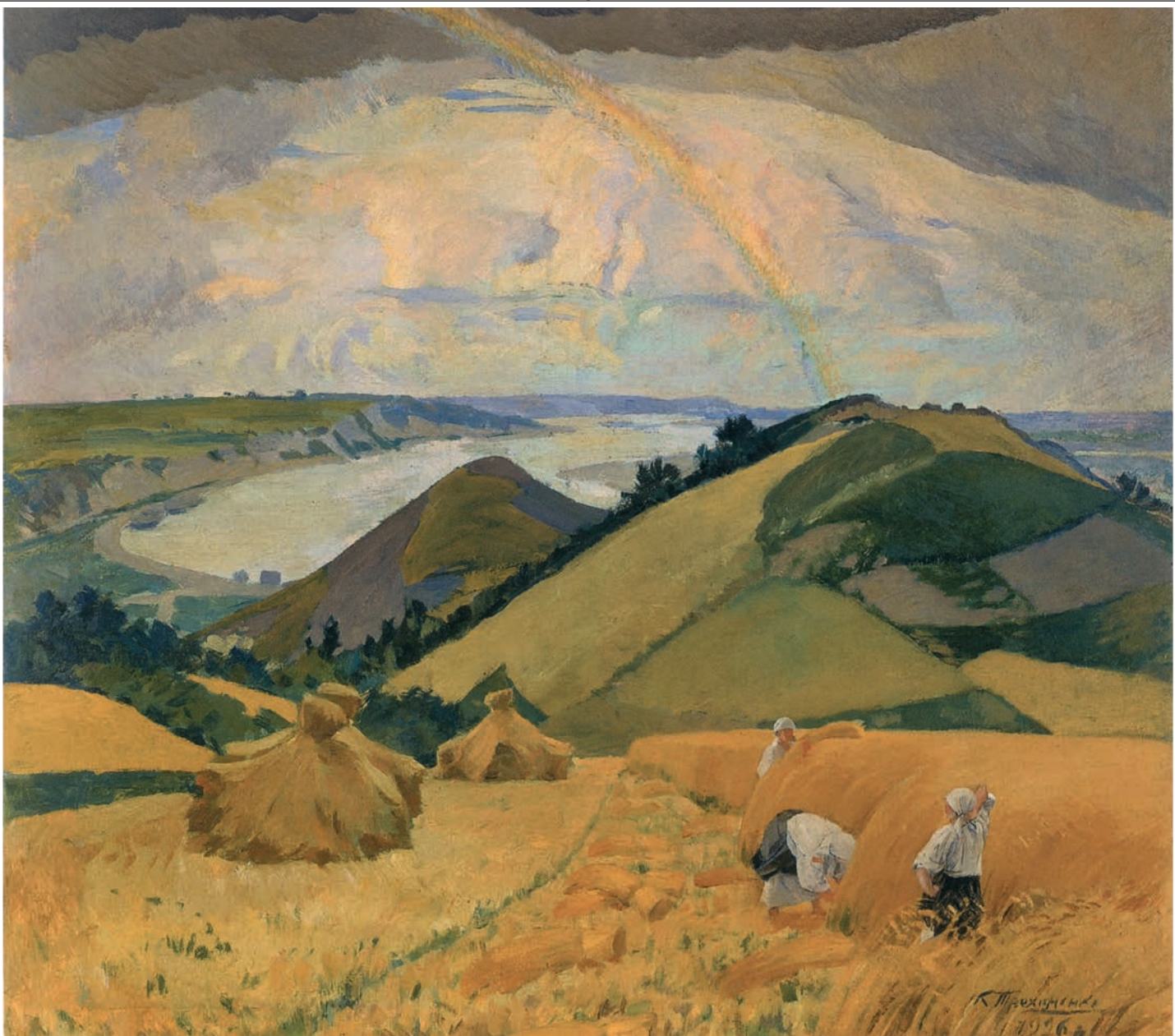
К. Трофименко. Над великим шляхом