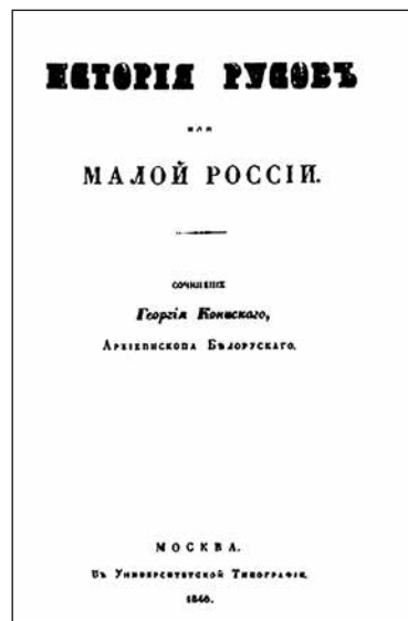
Обкладинка книги «Історія Русів»