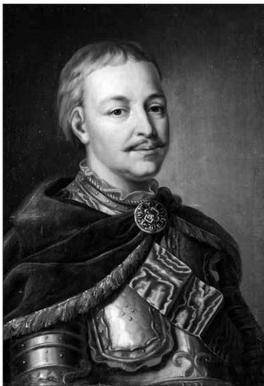
Портрет Івана Мазепа. Дніпровський художній музеї

Гетьман Іван Степанович Мазепа походив з українського шляхетського роду Мазеп-Колединських (інший варіант написання — Колодинських) православного віросповідання. Невідомий автор «Літопису Самовидця» твердив, що Мазепа зі «старожитної шляхти української і у Війську Запорозькому значної», а інший відомий український літописець кінця XVII—початку XVIII століття, Самійло Величко, називає гетьмана «значним козако-руським шляхтичем». На жаль, історики й сьогодні не мають точних даних, звідки походив рід Мазеп-Колединських. Олександр Оглоблін у своєму класичному дослідженні, присвяченому гетьманові Мазепі та його добі, згадує про версії волинського та подільського походження роду. На користь останньої говорить і той факт, що в XVII столітті на Поділлі (у Барському старостві) проживав рід Мазеп-Васютинських, які, можливо, були далекими родичами Мазеп-Колединських. Загалом же прізвище «Мазепа» було не таким уже й рідкісним на Правобережжі і до, і після гетьманування Івана Степановича, причому як у написанні «Мазера» (саме таким чином завжди писав своє прізвище гетьман), так і «Мазерра» або навіть «Мазієра». Люди з таким прізвищем фігурують у документах XVIII—XIX століть, а в XX столітті Ісаак Мазепа — відомий український політик (не родич гетьмана) — навіть встиг побути прем'єр-міністром УНР доби