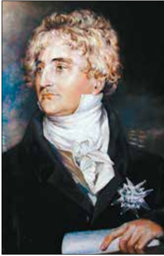
Дюк де Рішельє

1766 року у Франції, в одній із найвідоміших і найшановніших європейських родин. Він здобув блискучу освіту, розмовляв багатьма мовами, зокрема німецькою, англійською, італійською та російською. Діах вступив на військову службу в Росії, на якій завоював велику повагу та надбав дуже хорошу репутацію. Його дуже часто допускали до кола радників Катерини II, чоловік та-