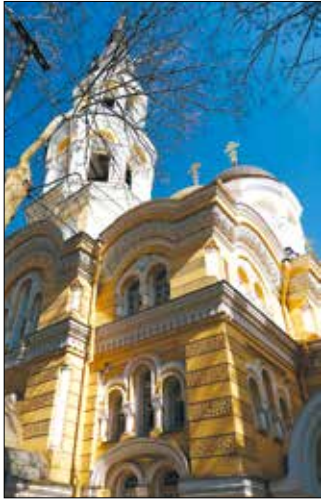
Монастир Св. Іллі

паломників. Монастир освятили 1896 року. Його збудували з цегли, що є рідкістю для Одеси. Цеглу доправляли з Феодосії і навіть із Константинополя.