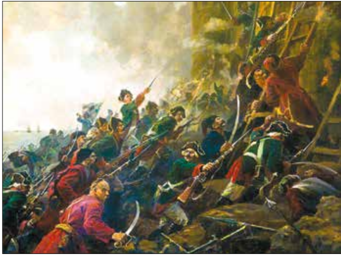
Взяття фортеці Хаджибей. Художник Петро Пархет