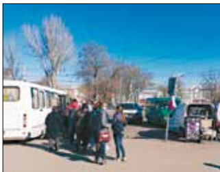
Черга на маршрутку до «Сьомого кілометра»

Базар «Сьомий кілометр» відкрили 1989 року з ініціативи людей, котрі, повертаючись із поїздок за кордон, намагалися продати там свій придбаний товар. Торгівля товарами, привезеними з-за кордону, була незаконною, але тогочасна влада часто заплющувала на це очі. Одеса як порто-франко завжди виділялася на тлі інших міст Радянського Союзу. Тут проживали тисячі моряків, котрі приво-