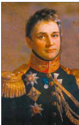
Граф Михайло Воронцов

муниципального водопостачання та закладання парків. Завдяки його зусиллям відкрили міську бібліотеку. Також відкрили багато готелів і ресторанів. Із порту у свій перший рейс вирушив пасажирський лайнер, водночас у майбутньому планувалося подальше сполучення з найбільшими чорноморськими портами. З розвитком освіти Одеса стала культурним і науковим центром імперії.