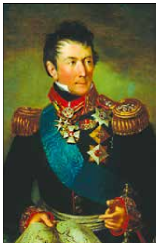
Граф Олександр-Луї Андро де Ланжерон

том Російської імперії за чисельністю населення, поступаючись лише Санкт-Петербургу, Москві та Варшаві. Рішельє був першим прихильником створення безмитної зони для порту, після нього й граф Олександр-Луї Андро де Ланжерон, котрий 1816 року прийняв посаду головного адміністратора міста.