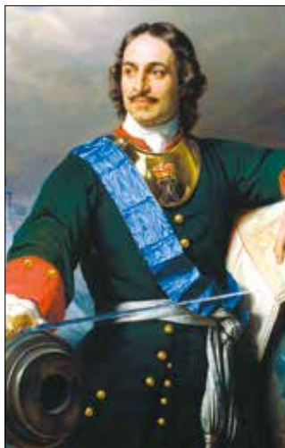
Цар Петро I

Цар Петро I здобув доступ до Балтійського моря для Росії в численних війнах, але всі добре розуміли, що для розвитку торгівлі та безпеки кордонів на півдні Російської імперії потрібен доступ до Чорного моря. Переваги від отримання доступу до Чорноморського узбережжя, на думку тогочасних фахівців, мали бути величезними як в економічному та політичному, так і військовому плані. Перевагу надавали переважно порти, в яких вода не замерза-