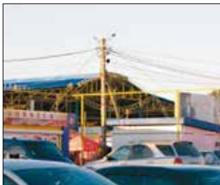
Базар «Сьомий кілометр»

зили з рейсів все — від жувальних гумок, джинсів, спідньої білизни та магнітофонних касет до презервативів, акумуляторів і глянцеvih журналів. Товари, привезені ними, користувалися величезним попитом, їх хапали миттєво. У крамницях бракувало багатьох товарів, здебільшого взуття й одягу, а ті, що були в продажі, відрізнялися жахливою якістю. Більшість жителів Одеси тепер знає «Сьомий кілометр» як місце, де можна купити дешевий одяг, взуття й інші предмети повсякденного вжитку. Звісно, у більшості випадків гендлярі пропонують на продаж підроблені товари. Цей базар вважається найбільшим