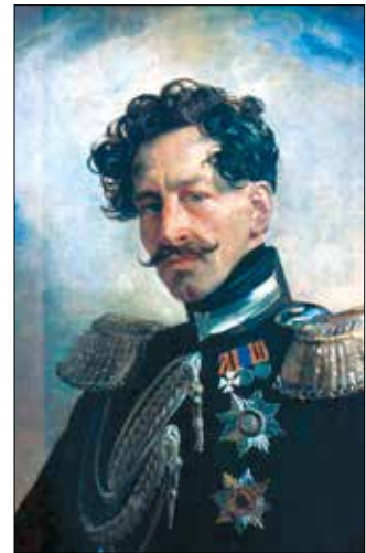
Павло Євстафіївич Коцебу

Строганов був заможною людиною і не раз влаштовував так звані відкриті обіди. Усі охочі могли взяти в них участь. Спеціаль-