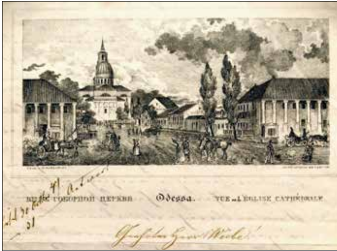
Преображенський собор. Вигляд з вул. Грецької. Рисунок Попандопуло, літографія Браун. 1843—1844

англійські та французькі кораблі, часто відбувалися спроби висадити десант. Один із кораблів, залишених англо-французькою армією 30 квітня 1854 року, сів на мілину, і його обстріляли з одеських гармат. Його команда здалася, а одна з гармат і досі стоїть на початку Приморського бульвару біля будівлі міської ради.