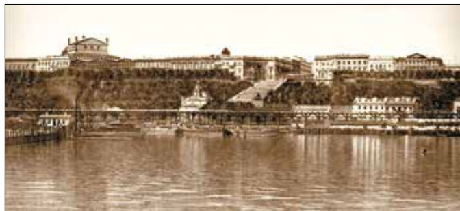
Панорама Одеси з моря. Фотографія початку XX століття

У 1867–1878 рр. керівництво перейшло до Миколи Олександровича Новосельського. Як і його попередники, він зробив для міста багато корисного. Передусім вирішив проблему водопостачання. Життя одеситів стало комфортнішим. За часи, коли містом керував Новосельський, зросла кількість поліцейного складу та медичного персоналу, багато вулиць отримало освітлення.