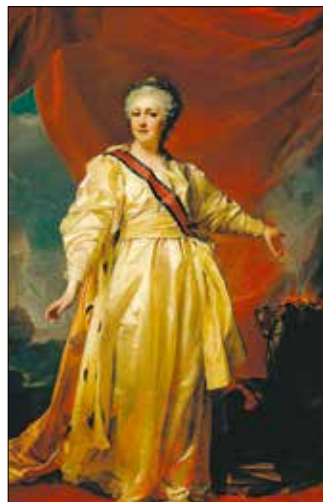
Цариця Катерина II

ла більшу частину зими, і, що ще важливіше, з'являвся прямий доступ до Середземномор'я. Завдяки сучасній стратегії та спритній дипломатії в той час, османські турки та кримські татари почали загрожувати Катерині II, тодішній цариці. На її повеління розпочалося будівництво військових і торгових кораблів.