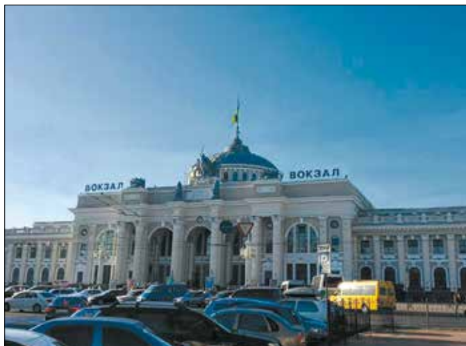
Залізничний вокзал в Одесі

Безпосередньо перед вокзалом зупиняються маршрутки, якими можна дістатися до найбільшого в цій частині Європи ринку під назвою «Сьомий кілометр». Вартість проїзду — 10 грн. На стовпі автобусної зупинки висить невеличкий гучномовець,