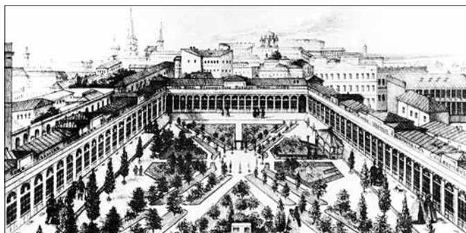
Площа «Пале-Рояль». Літографія XIX ст.

На посаді генерал-губернатора Новоросії Воронцов суттєво сприяв розвитку міста. Він перетворив Одесу на велике торгове місто на півдні Росії та розширив статус порто-франко. Він завершив будівництво Миколаївського бульвару, який лише в пізніші роки отримав назву Приморського, а його спорудження розпочалося ще за часів графа де Ланжерона. За короткий час в одному кінці бульвару збудували чудовий палац, а 1841-го — і знамениті сходи. Граф Воронцов турбувався про розвиток та утримання