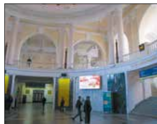
Зал залізничного вокзалу

жінки з голубом миру в руках, що має символізувати героїзм одеситів у часи Другої світової війни. На Одеському залізничному вокзалі є практично все необхідне для пасажирів — від поштового відділення до перукарні, аптеки, камери зберігання, кіосків з їжею та сувенірами, ресторанів і кафе.