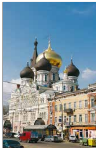
Монастир Св. Пантелеймона

Під № 79 на Пушкінській вулиці розмістився напрочуд гарний монастир Св. Іллі , який заснували 1884 року з метою координації паломництва з Росії до святої гори Афон у Греції, організації, розміщення та перевезення.