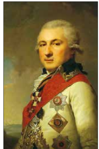
Осип де Рібас

Одеса завдячує своєю назвою Катерині II. Існує легенда, що під час одного з балів у присутності цариці затіяли балачки про будівництво нового чорноморського порту на місці фортеці Хаджибей, нещодавно завойованої російським військом. Знаючи царську