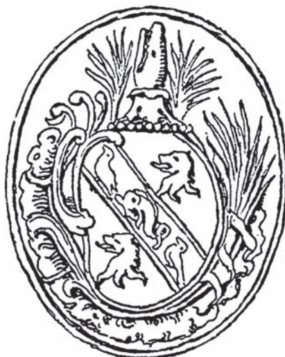
Печатка Бенджаміна Франкліна