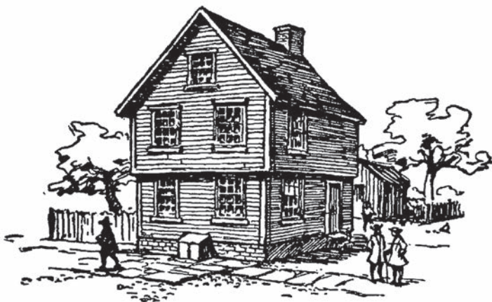
Місце народження Франкліна. Мілк Стрит, Бостон

та поодружувались. Я народився в Бостоні, Новій Англії 8 й був наймолодшим сином і третьою наймолодшою дитиною. Моєю матір'ю була друга жінка Йосія, Авія Фолгер, дочка Пітера Фолгера, одна з перших поселенок Нової Англії, почесна згадка про яку зроблена Коттоном Матером 9 у його церковній історії цієї країни Magnalia Christi Americana , тобто «Побожний, навчений англієць», якщо мені не зраджує пам'ять. Я чув, що він писав час від часу різноманітні маленькі твори, але лише один із них було надруковано, його я побачив багато років потому. Його рядки про той час і людей тої епохи було написано 1675 року, адресувались вони людям тодішнього уряду. Він писав про свободу совісті й про баптистів, квакерів та