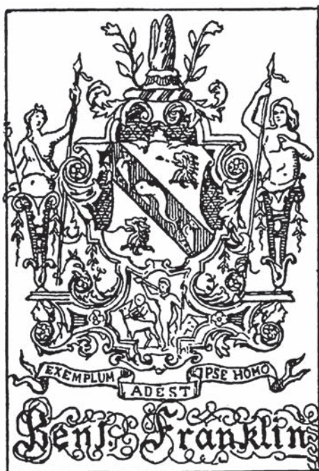
Герб Бенджаміна Франкліна