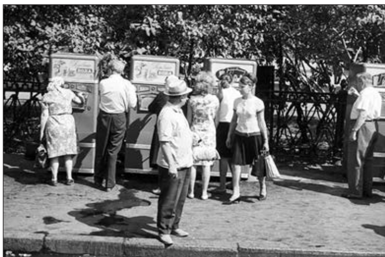
Автоматы с газированной водой. Стакан: 1 копейка, с сиропом — 3 копейки