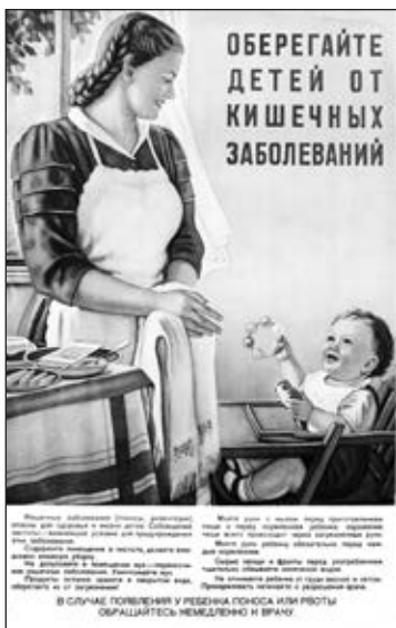
Плакат Р. Н. Берковец. 1952 год

Да, сколько еще их было, этих чудес света... Маленькое окошко из кухни в ванную — что там смотреть, объясните? Не пользуется ли сосед по коммуналке вашим мылом?! Однажды я убедился в важности этого окошка, когда мы с женой и мамой впервые купали на кухне старшего сына — Гену. Отец стоял на крышке унитаза и через окошко зна-