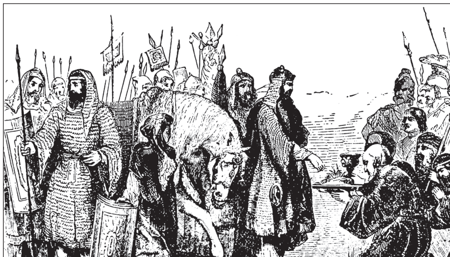
Афіняни передають «землю і воду» персам

Проте афінське посольство примудрилося припуститися ще однієї, набагато важчої помилки. Воно не лише пого-