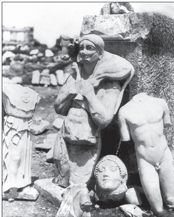
Скульптури із афінських храмів, зруйнованих після здобуття міста персами

Ворожі кораблі й справді невдовзі з'явилися на горизонті, однак попереджені містяни зустріли їх в озброєнні, просигналивши таки своїми щитами, що заскочити їх несподі-