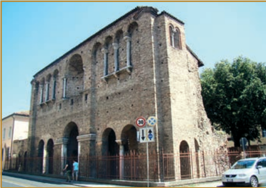
Палац Теодоріха в Равенні (сучасний вигляд)

4. Італія під владою Теодоріха Великого. В той час, коли Хлодвіг підкорював Галлію, Іта-