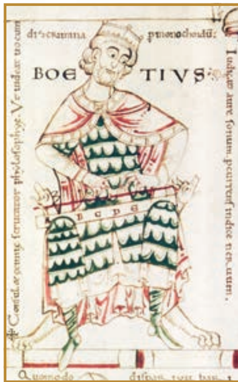
Боецій. Мініатюра XII ст. (Бібліотека Кембріджського університету)

ти між собою власних підданих так і не зміг. Для колишніх римських громадян він залишався чужинцем, який до того ж вперто тримався аріанства. Коли ж до Теодоріха дійшли чутки, що римляни з його оточення готують змову, король жорстоко розправився з усіма підозрюваними. Серед інших стратили римського папу та колишнього найближчого радника короля, філософа Боеція . А невдовзі помер і сам Теодоріх.