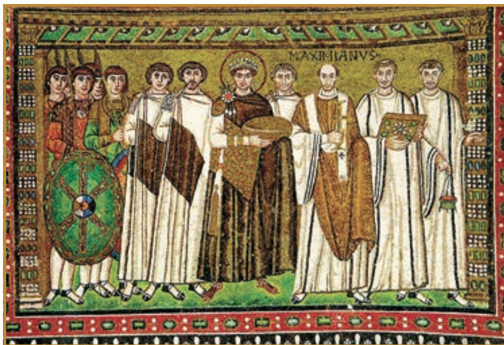
Імператор Юстиніан I із придворними. Мозаїка в церкві Сан-Вітале (Равенна)

1. Юстиніан I і спроба відродження «світової імперії». Відновити Римську імперію в усій її величі мріяв імператор Юстиніан I . Він упорядкував управління державою та збір податків, карав хабарників і водночас збільшив плату чиновникам, доручив переглянути й узгодити між собою всі закони, які діяли на той час у