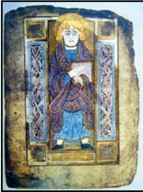
Євангеліст Іоанн. Мініатюра з ірландського рукопису VIII ст. (Бібліотека Трінті-коледжа в Дубліні)

ців, слов'ян. Чимало монастирів виникло в цей час в Ірландії , яка ніколи не знала влади Риму. Вихідці з цих монастирів дивували своїми глибокими знаннями навіть римських пап, і при цьому залишалися невтомними проповідниками, що в своїх мандрах досягали найвіддаленіших куточків Європи.