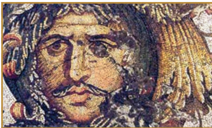
Варварський ватажок. Фрагмент мозаїки V ст. з імператорського палацу в Константинополі

Проте це не були часи суцільного занепаду. Володарі держав, що виникли на руїнах імперії, вважали себе її спадкоємцями і, як могли, дбали про свою «спадщину». Здобутки стародавньої вченості плекала й церква. Християнські ченці і надалі поширювали вчення Ісуса не лише серед мешканців колишніх римських провінцій, а й серед «варварів» — кельтів, герман-