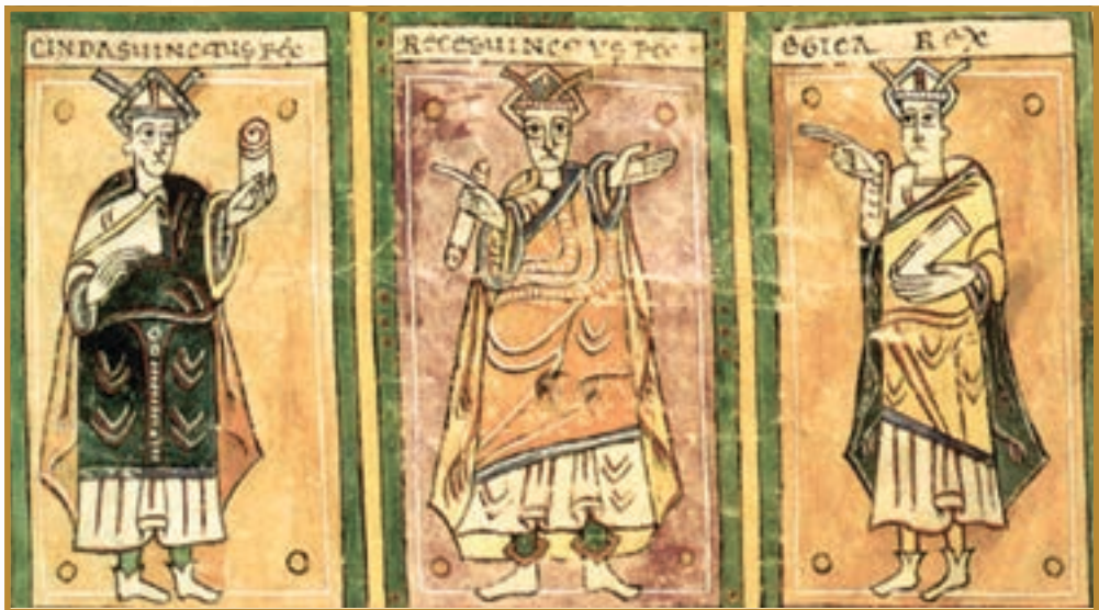
Вестготські королі. Мініатюра X ст. з «Кодексу Вігілі» (Музей Ескоріала)

Більшість мешканців новоутворених королівств були колишніми римськими громадянами. Вони розмовляли латиною, жили за законами часів імперії і належали до церкви, яку очолював римський патріарх (або ж папа римський ), тоді як «варвари» здебільшого були аріанами . З-поміж римлян були люди різних статків — і бідняки, які ледве зводили кінці з кінцями, і магнати, що іноді мали одразу по кілька маєтків у різних провінціях та чимало рабів. Тримати невільників у покорі в неспокійний час було складно, тому рабам зазвичай дозволяли заводити своє господарство. А найчастіше землю обробляли вільні селяни, які віддавали землевласникам