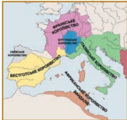
Варварські королівства у 526 році

змін володарів теж звикли. Та й Рим вже майже як два століття не був столицею, і його вже кілька разів встигли захопити і пограбувати війська «союзників», яких імператори самі запросили до себе на службу. Із втратою влади останнім імператором Італія перетворилася на ще одне «варварське» коро-