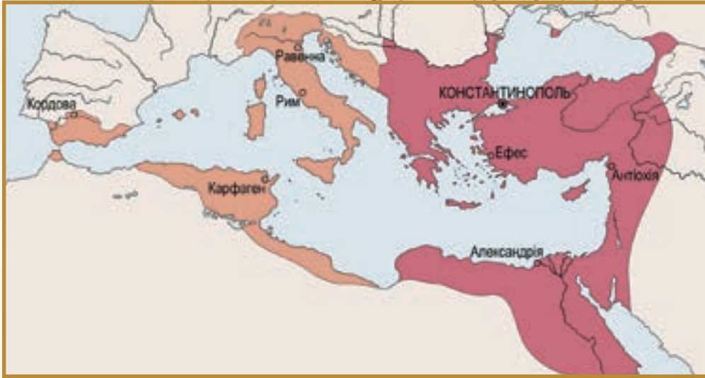
Розширення Візантійської імперії за правління Юстиніана I

імперії, — так з'явився славнозвісний Кодекс Юстиніана . Імператор намагався допомагати містам, захищав їхніх мешканців від зазіхань магнатів і водночас зміцнював владу власників над рабами і колонами.