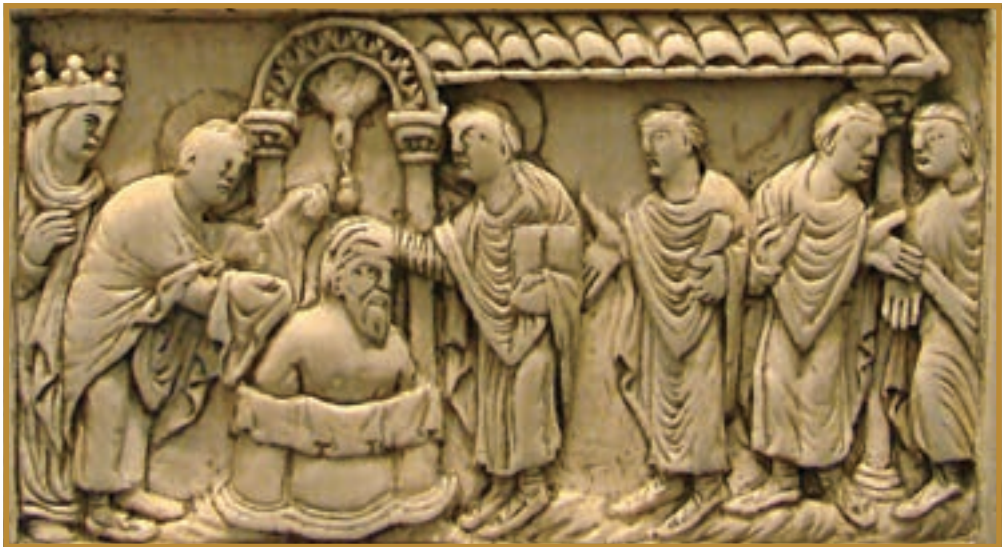
Хрещення Хлодвіга. Кістяний рельєф IX ст. (Музей Пікардії)

3. Хлодвіг та утворення Франкської держави. Після падіння Західної Римської імперії самостійним володарем намагався стати і колишній римський намісник Північної Галлії. Але проти нього повстали племена франків, що оселилися в цих краях за часів імперії. Їхній ватажок Хлодвіг , який належав до роду Меровінгів , здобув перемогу