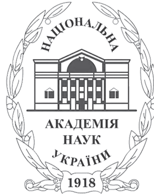
Логотип НАН України

де написано, що питання це закрите раз і назавжди. Хоча треба сказати, що вони (Росія) посилаються на те, що вони мають за спиною прецедент 1991 року, коли тодішній прес-секретар Єльцина Вощанов опублікував за прямою вказівкою своїх керівників заяву (потім його дрючили за це неймовірно, її спростували, що це не вони, це його