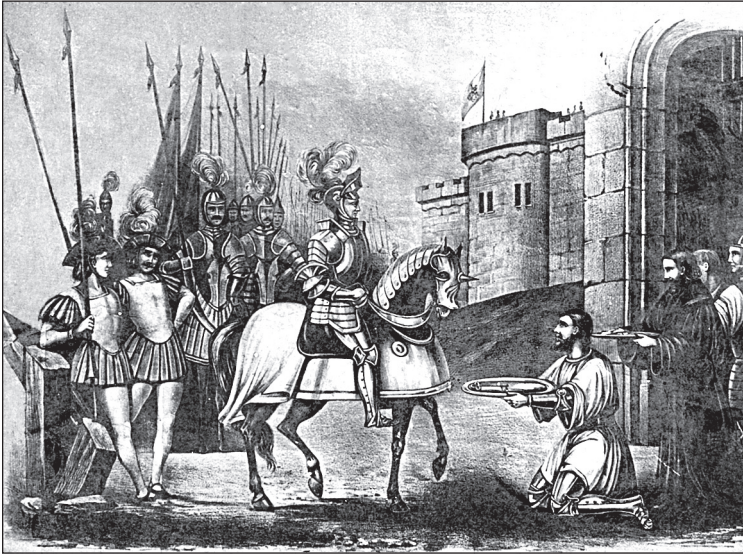
В'їзд князя Гедиміна до Києва у 1321 р. Гравюра XVIII ст.

— Так, очевидно, я кажу тільки по цій трасі очевидній, яка на південь, Васильків — село Митниця, а далі антропологічний вакуум, нічого ж не було, був трохи заселений Поділ. Усі кричали Київ-Київ, це був Києво-Поділ, Києва, верхнього міста, не існувало, воно було засновано — ми перескакуємо з теми на тему — як протидія всім польським впливам. Отже, ми були частиною центрально-східного європейського простору, були частиною