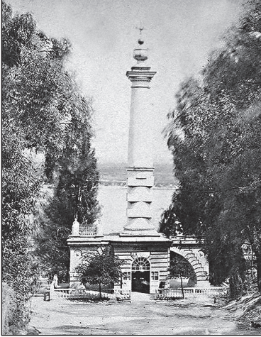
Колона Магдебурзького права у Києві

ваним світом і Росію проходив десь біля Львова. У 2004 році, коли був перший Майдан, кордон між цивілізованим світом і Росією зсунувся до Дніпра. У 2014-му ми зрозуміли, що лінія фронту пролягає між українськими військами і сепаратистами та російською армією. І ми розуміємо, що цей кордон — це раз кордон між Європою та Росією. В Європі кор-