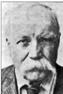
П. Андрієвський (1878—1955 рр.). Суспільне надбання

нала своєї головної мети — зміцнення та збереження самостійної української державності — можна говорити про формальну поразку українських визвольних змагань 1917—1920 рр. Ці процеси були лише етапом становлення українського суспільства і держави 1 — взагалі не вкладається в межі наукового дискурсу. Напри-