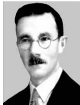
І. Мазепа (1884—1952 рр.). Суспільне надбання