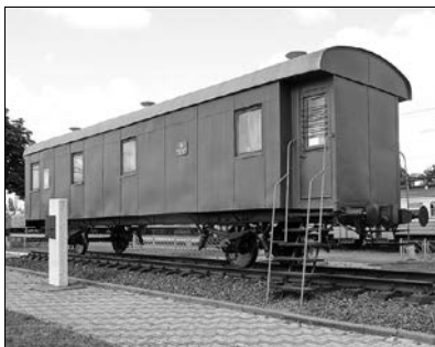
Вагон-музей злуки УНР та ЗУНР. Фастів. Сучасний вигляд. Суспільне надбання