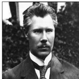
Ф. Швець (1882—1940 рр.). Суспільне надбання

Останній фундаментальний висновок «з огляду на те, що Директорія УНР не вико-