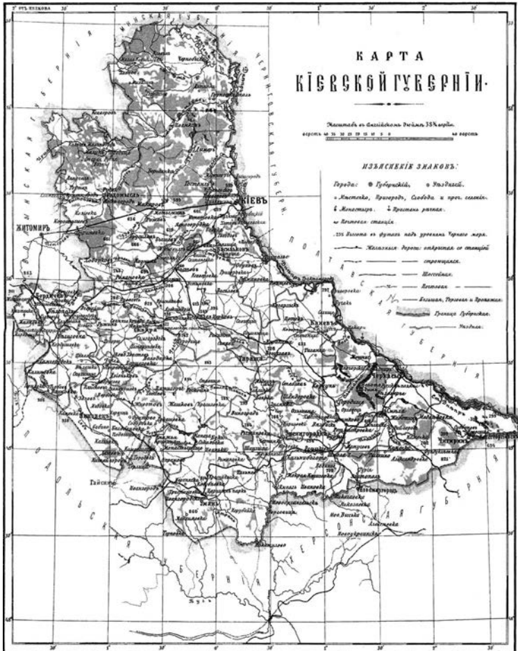
Карта Київської губернії

Шамраївка , с. Сквирського району. Спиридонівська церква (1849 р.).